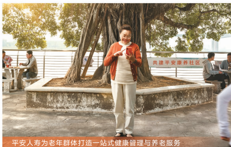
平安人寿为老年群体打造一站式健康管理及养老服务

奋力推进乡村振兴,探索打造“三农”金融示范。 中国平安用足用好金融力量,服务乡村振兴,截至2022年底,累计投放乡村振兴资金近650亿元。中国平安探索升级“三下乡”模式,发挥“综合金融+医疗健康”优势,以“保险下乡、金融下乡、医疗健康下乡”为抓手,聚焦发展优势农业产业、建设和谐美丽乡村两条主线,通过保险深度参与的“振兴保”产业振兴模式,助力28万农户稳步增收,巩固拓展脱贫攻坚成