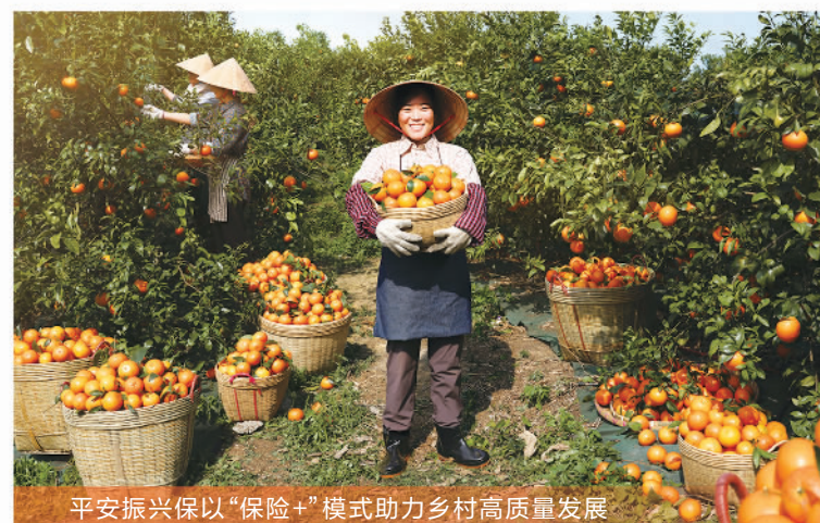
平安振兴保以“保险+”模式助力乡村高质量发展