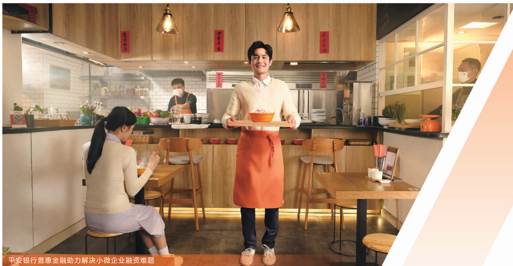
平安银行普惠金融助力解决小微企业融资难题