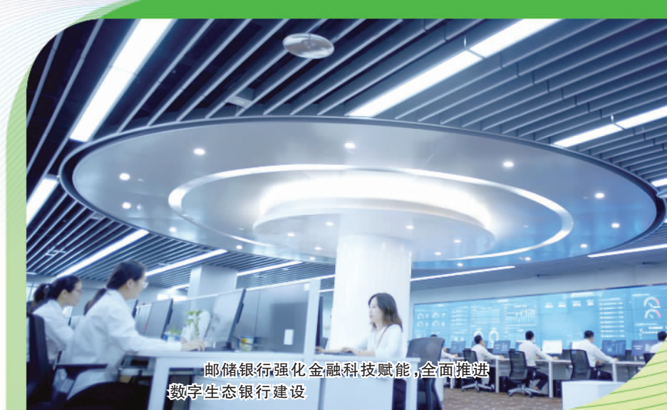
邮储银行强化金融科技赋能，全面推进数字生态银行建设。