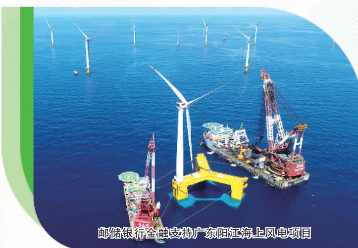
邮储银行金融支持广东阳江海上风电项目。

在优化资源配置方面，邮储银行加大资源倾斜力度，大力支持低碳交通、可再生能源、清洁能源、绿色建筑、节能环保等绿色金融重点领域。为具有显著碳减排效应的绿色项目提供优惠利率；对绿色信贷、绿色债券给予内部资金转移定价优惠支持；对绿色信贷等绿色金融业务采用差异化经济资本计量系数。