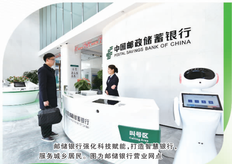
邮储银行强化科技赋能，打造智慧银行，服务城乡居民。图为邮储银行营业网点。