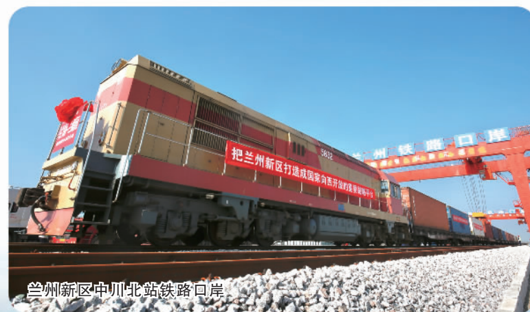
兰州新区中川北站铁路口岸