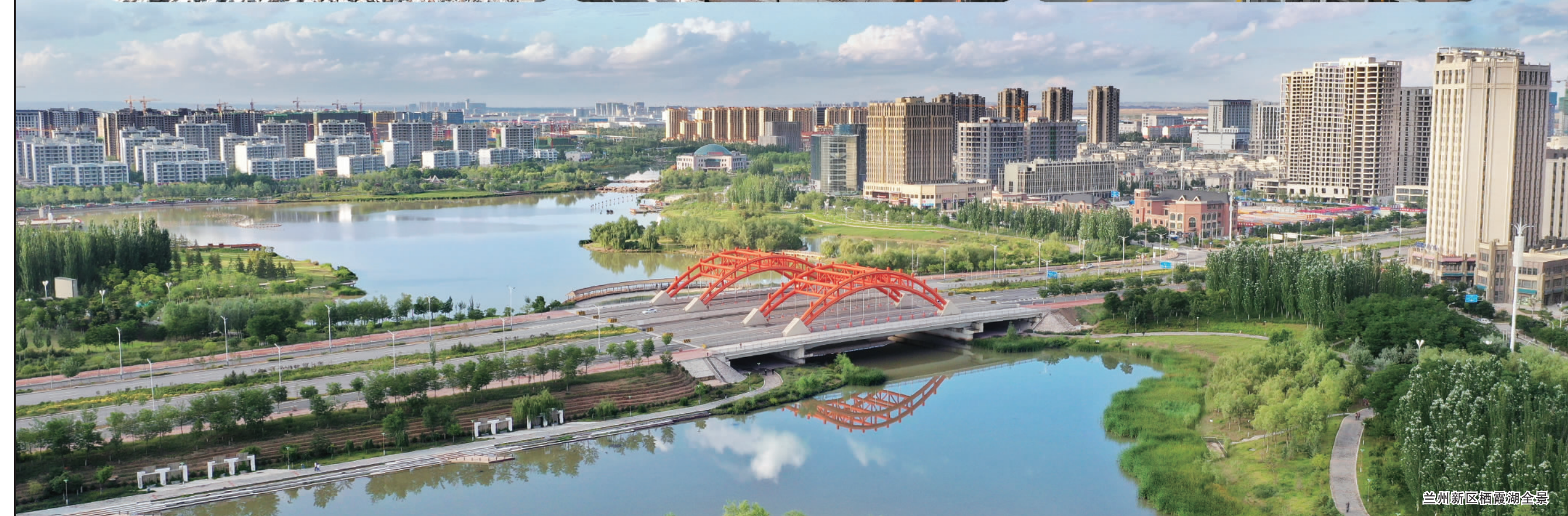
兰州新区栖霞湖全景