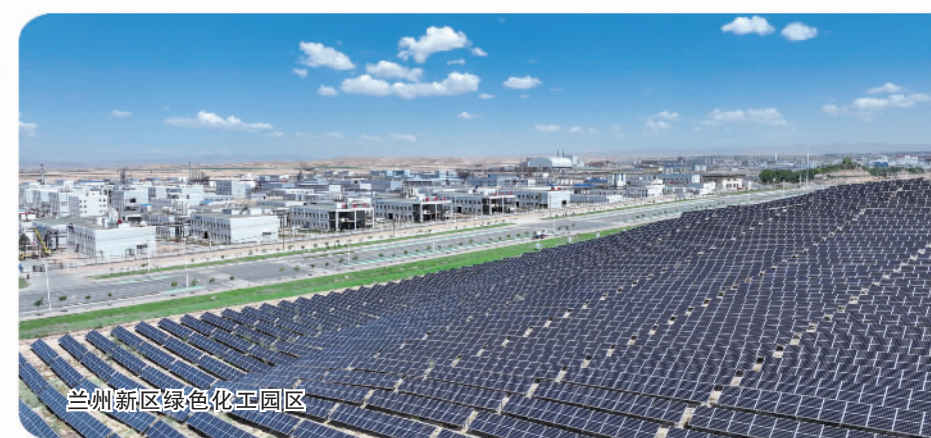
兰州新区绿色化工园区

坚持“强龙头、补链条、聚集群”,兰州新区把做实做强做优实体经济作为主攻方向,以实施产业倍增行动为牵引,坚持区域化布局、上下游协同、集群化发展,以非常之举、非常之策抓招商育产业提质效,加速带动产业拓存创增、集聚壮大。截至目前,兰州新区累计引进优质产业项目1080个、总投资5280亿元,产业投资、工业增加值年均增长50%以上。随着一批重大产业项目建成投产,全球最大的高性能铜箔生产基地、百万吨级“新能源新材料之谷”、国内一流的千亿级化工产业园、百亿级“西部药谷”、3万台机柜的大数据中心快速形成,食品加工、临空经济、应急救援、氢能等特色产业多点开花、齐头并进。