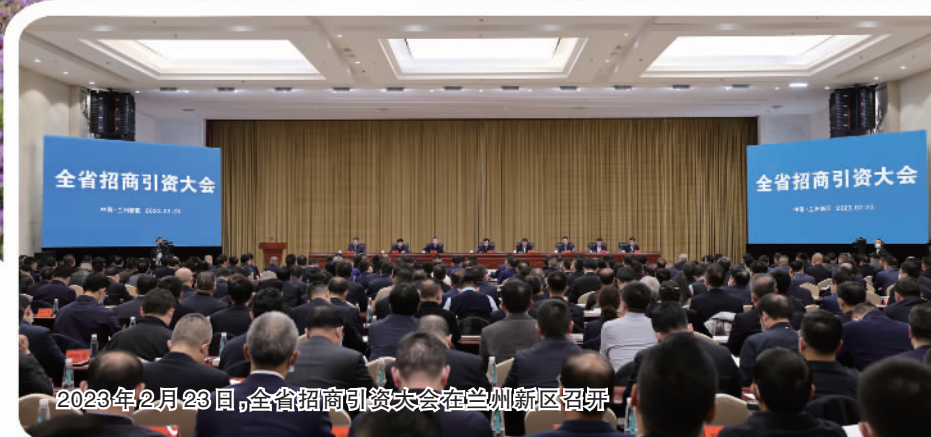
2023年2月23日,全省招商引资大会在兰州新区召开

产业项目的快速引进、落地、建设离不开优质的营商环境。兰州新区坚持把优化营商环境作为推动经济社会高质量发展的头等大事、重点工程,全力贯彻落实省委、省政府“优化营商环境攻坚突破年”行动部署,强化全方位政策供给、全生命周期服务,以审批事项少、流程简、时限短的政务环境服务项目顺畅落地、快速建设,成为西部最具投资吸引力的地区之一。在2023年一季度全省重大项目集中开工活动中,兰州新区集中开工项目39个、总投资306亿元,其中产业链项目占比均超过70%,为全省上下大抓招商、大抓项目、大抓产业树立新标杆。