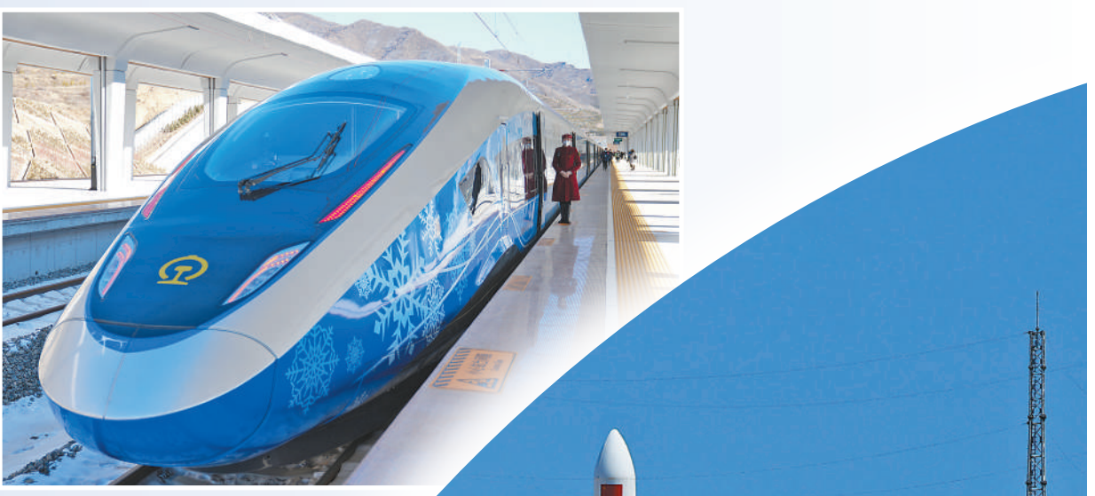
G9981次北京冬奥列车停靠在京张高铁崇礼站。