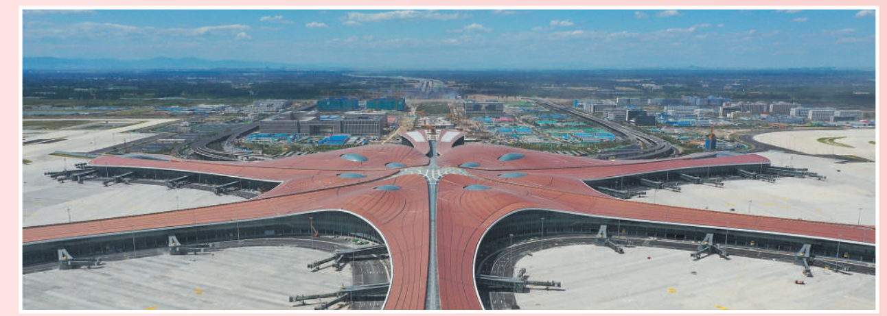
俯瞰北京大兴国际机场。