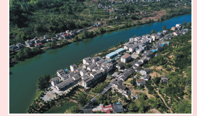
重庆市黔江区濯水镇甘家坝易地扶贫搬迁安置点。