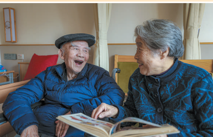
江苏省徐州市鼓楼区,在一家养老服务中心,老人安享晚年。