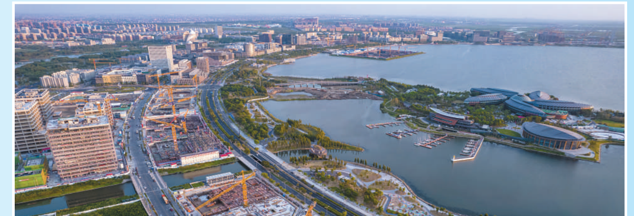
上海自贸试验区临港新片区滴水湖畔,塔吊林立,多个重点项目建设如雨后春笋般拔地而起。