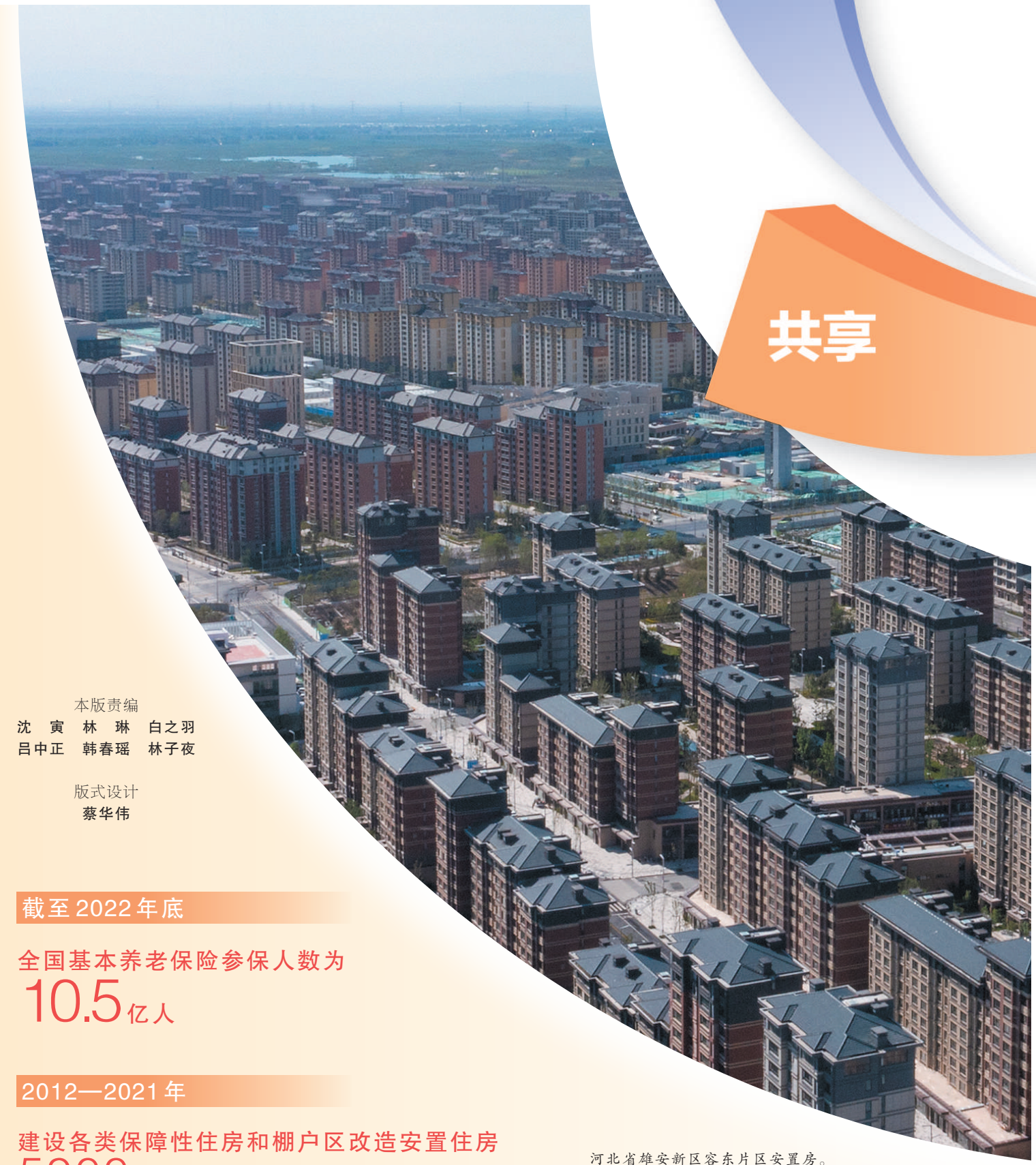
河北省雄安新区容东片区安置房。