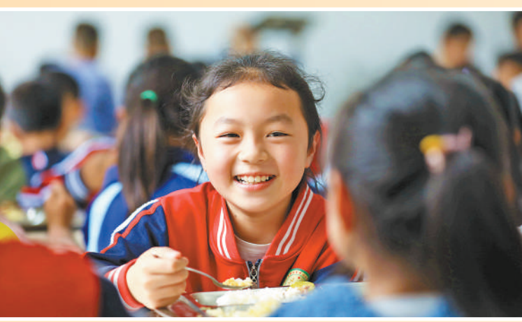
贵州省从江县,刚边壮族乡中心小学学生在吃营养餐。