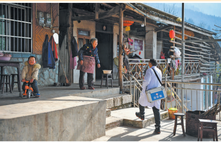
四川省北川羌族自治县曲山镇石牌坊村,村医入户走访重点人群,提供医疗服务。