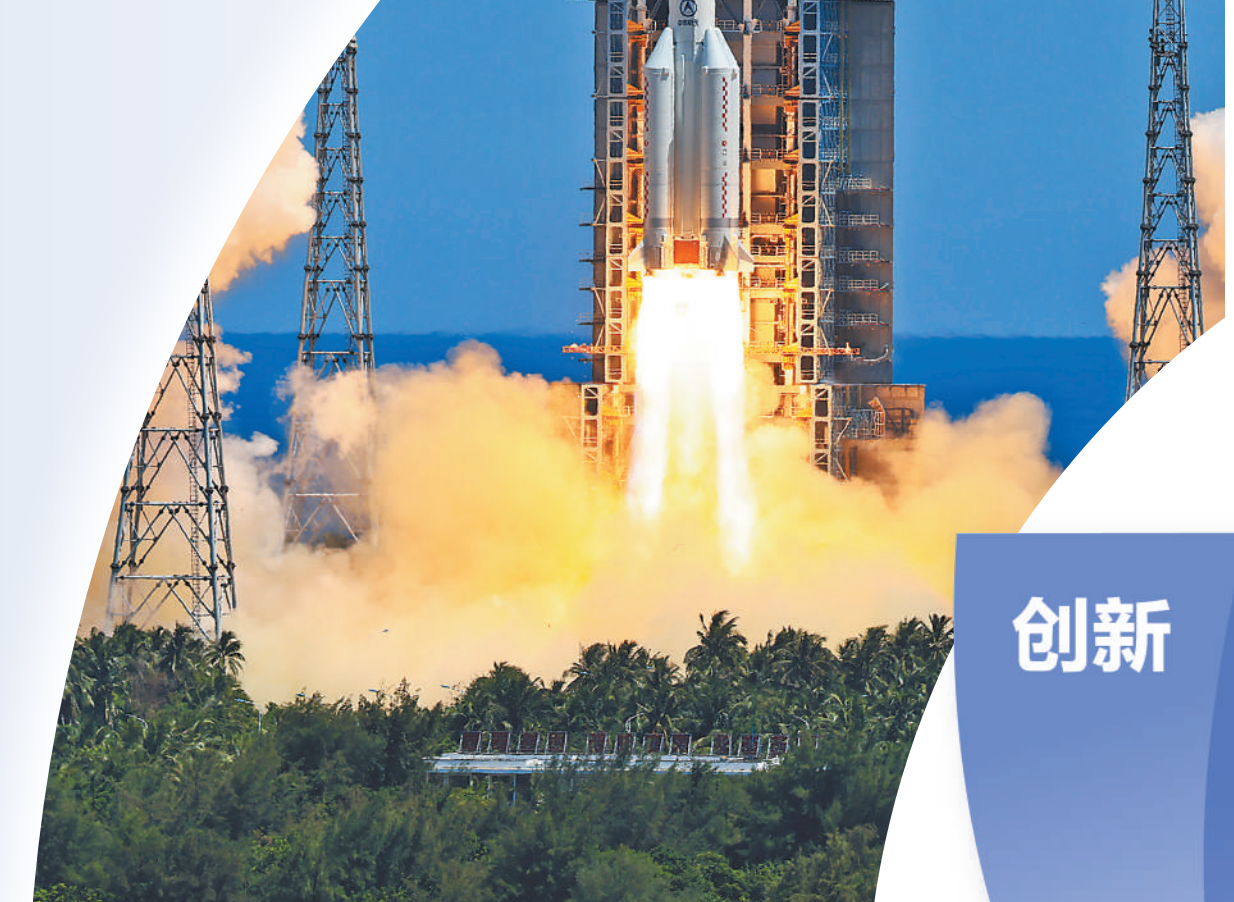
搭载问天实验舱的长征五号B运载火箭,在海南文昌航天发射场点火发射。