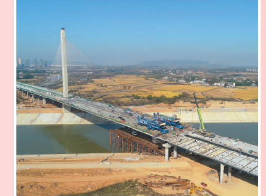
安徽省合肥市庐江县,无垠(无为—岳西)高速建设正在推进。该高速建成后,将加速长三角一体化进程。