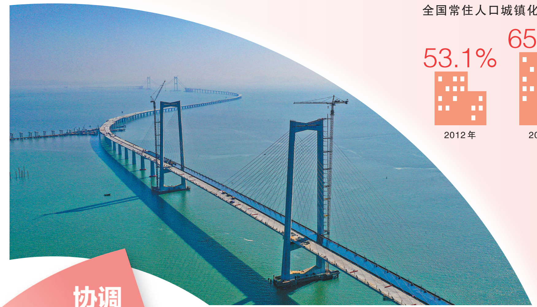
广东深中通通道施工现场。