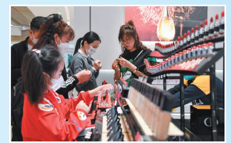
海南省海口市的国际免税城内,游客在选购免税商品。