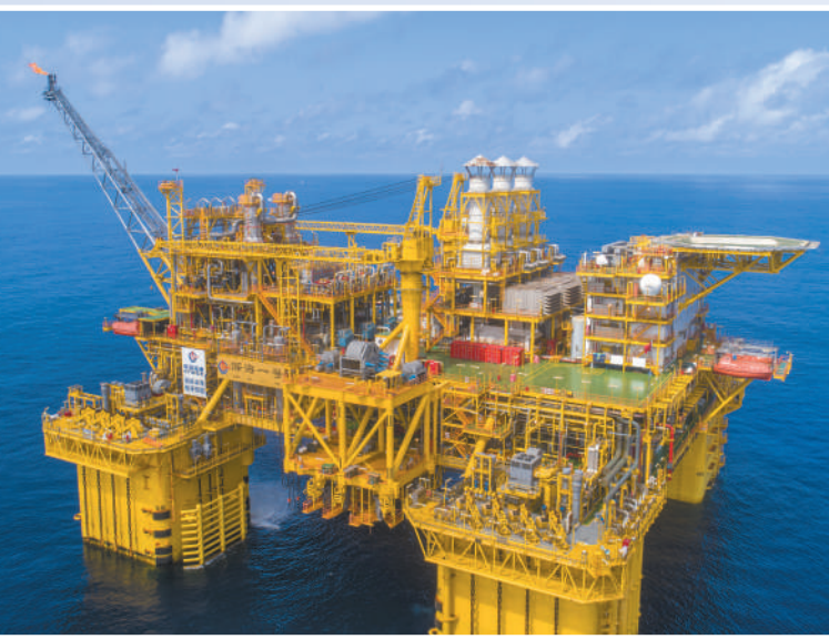
位于海南省陵水海域的“深海一号”能源站。