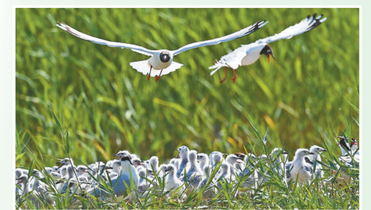
陕西省神木市红碱滩国家级自然保护区,遗鸥在岛上飞翔。