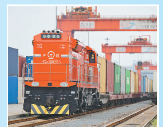
河南省郑州市,中欧班列从中国铁路郑州局集团有限公司圃田站启程,满载货物驶向海外。