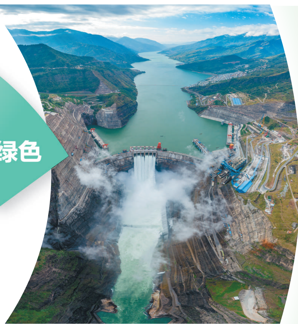
位于川滇交界处的白鹤滩水电站风貌。

2022年,面对风高浪急的国际环境和艰巨繁重的国内改革发展稳定任务,以习近平同志为核心的党中央团结带领全党全国各族人民迎难而上、沉着应对,全面落实疫情要防住、经济要稳住、发展要安全的要求,加快构建新发展格局,着力推动高质量发展,引领中国经济大船乘风破浪向前。 质,有效提升;量,合理增长。中国经济迈开铿锵步履,高质量发展的成色越来越足—— 创新发展活力奔涌。构建新引擎,制胜新赛道,新动能引领作用日益凸显。 协调发展成效显著。全面推进城乡、区域协调发展,国内大循环的覆盖面不断提高,发展底盘更稳空间更广。 绿色发展扎实推进。产业转型加快,减排降碳发力,我国发展的“含金量”和“含绿量”显著提升。 开放发展阔步向前。加快推进高水平对外开放,2022年外贸外贸再创历史新高,我国正持续成为全球投资兴业的热土。 共享发展温暖民心。2022年,我们坚持在发展中保障和改善民生,让改革发展成果更多更公平惠及广大人民群众。 回首过往,底气十足,面向未来,信心坚定。只要完整、准确、全面贯彻新发展理念,加快构建新发展格局,着力推动高质量发展,就一定能推动经济运行整体好转,实现质的有效提升和量的合理增长,为全面建设社会主义现代化国家开好局起好步。 (本报记者 刘志强)