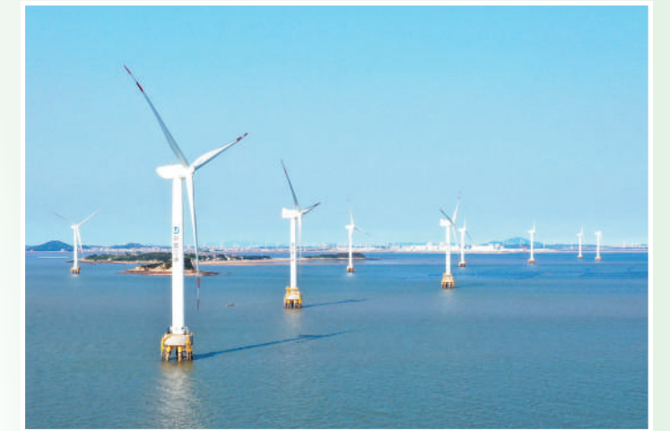
福建省福清市,兴化湾海上风电场一角。