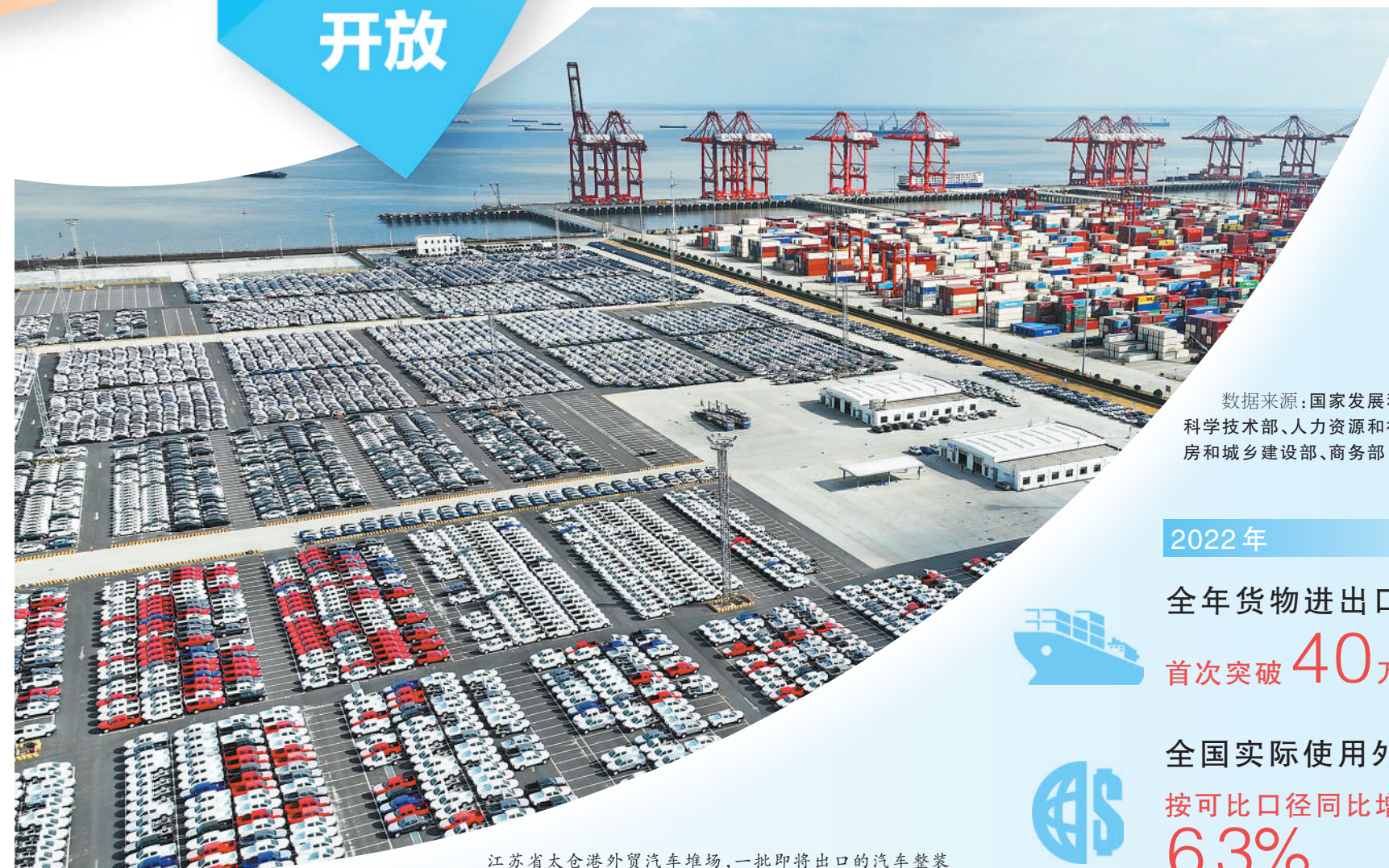
江苏省太仓港外贸汽车堆场,一批即将出口的汽车整装待发。