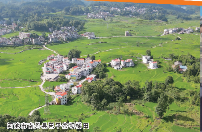
河池市南丹县巴平镇坝梯田