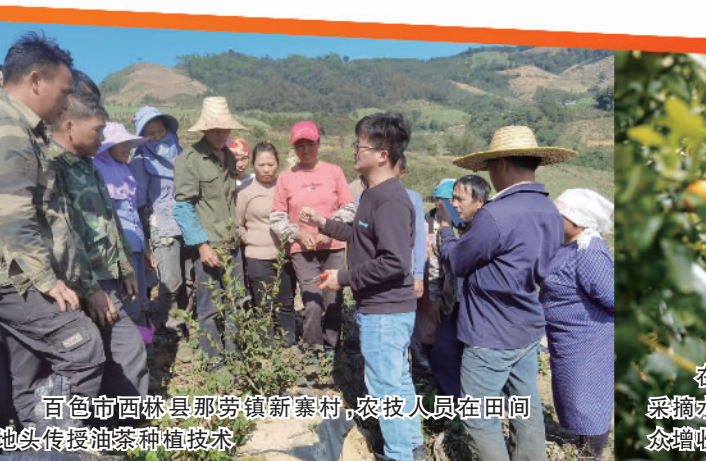
百色市西林县那劳镇新寨村，农技人员在田间地头传授油茶种植技术