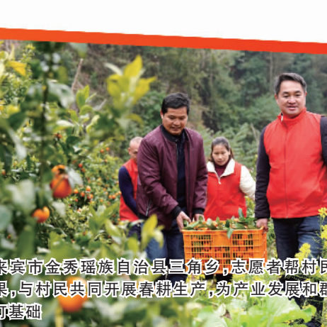
在来宾市金秀瑶族自治县三角乡，志愿者帮村民采摘水果，与村民共同开展春耕生产，为产业发展和群众增收打基础