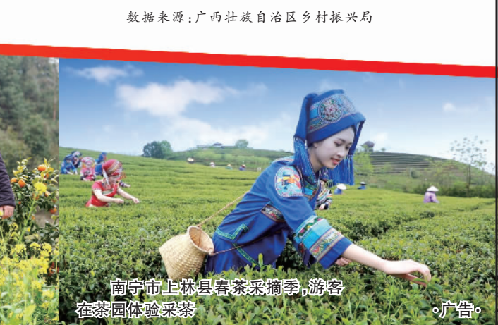
南宁市上林县春茶采摘季，游客在茶园体验采茶