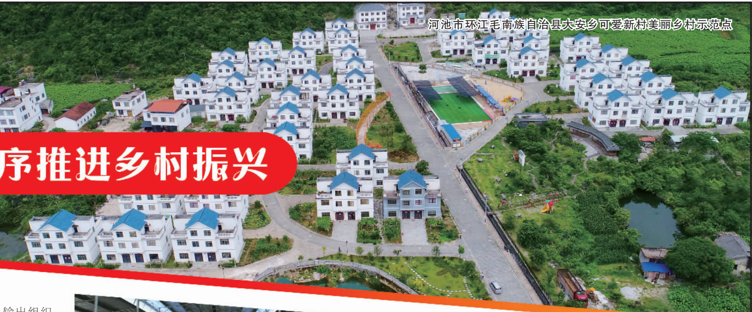
河池市环江毛南族自治县大安乡可爱新村美丽乡村示范点

2022年，广西壮族自治区全面贯彻落实党中央、国务院重要决策部署，把做好巩固拓展脱贫攻坚成果同乡村振兴有效衔接工作作为立区之本和首要任务，严格落实“自治区负总责、市县抓落实、工作到村、帮扶到户”责任制和“五级书记”抓乡村振兴机制，脱贫成果持续巩固、乡村振兴有序推进。