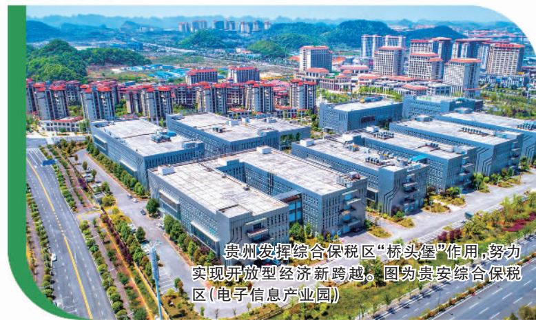
贵州发挥综合保税区“桥头堡”作用,努力实现开放型经济新跨越。图为贵安综合保税区(电子信息产业园)