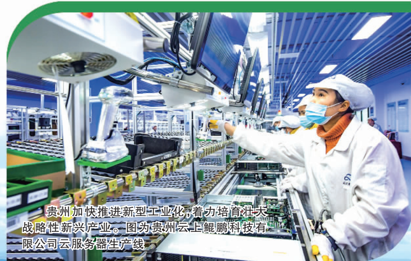
贵州加快推进新型工业化,着力培育壮大战略性新兴产业。图为贵州云上鲲鹏科技有限公司云服务器生产线