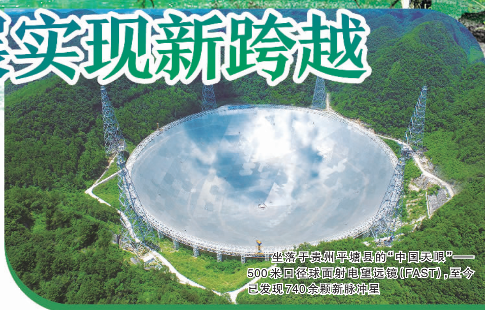
坐落于贵州平塘县的“中国天眼”——500米口径球面射电望远镜(FAST),至今已发现740余颗新脉冲星