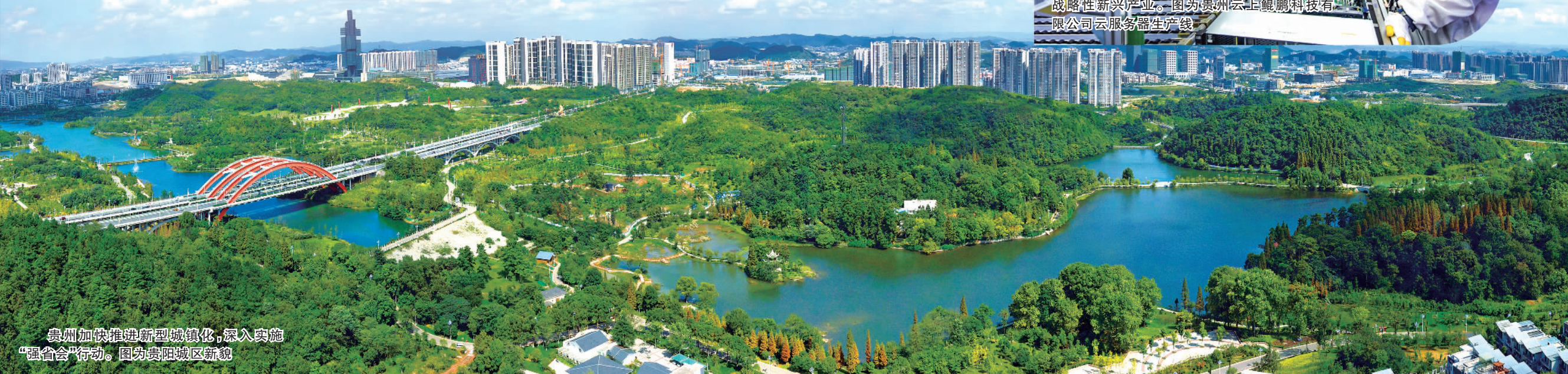
贵州加快推进新型城镇化,深入实施“强省会”行动。图为贵阳城区新貌