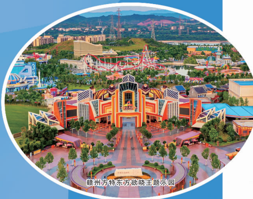
赣州方特东方欲晓主题乐园