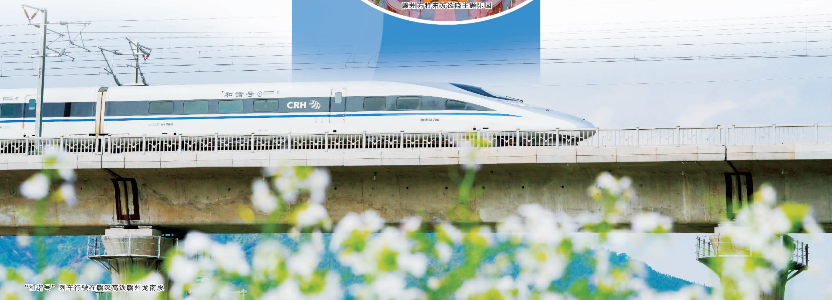
“和谐号”列车行驶在赣深高铁赣州龙南段