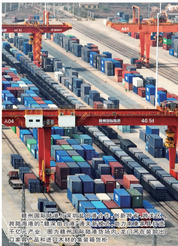
赣州国际陆港与深圳盐田港合作，创新跨省、跨关区、跨陆海港的“赣深组合港”通关新模式，助力南康家具制造千亿元产业。图为赣州国际陆港货场内，龙门吊在装卸出口家具产品和进口木材的集装箱货柜