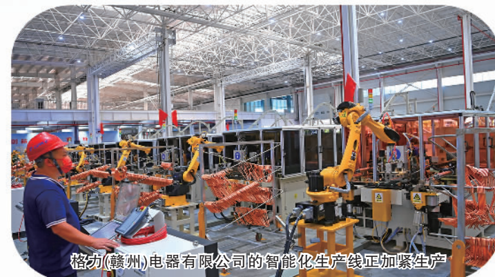
格力(赣州)电器有限公司的智能化生产线正加紧生产

年正式开通赣(州)深(圳)城际高速货运班列“融湾号”，全程运行平均时间由原来的12小时压缩至6小时，实现陆海港资源共享共用、业务无缝对接、货物快速通关。2022年11月28日，“赣穗组合港”首发班列发行，正式启用广州港(赣州)云堆场。资本融湾步伐不断加快，2022年，赣州4家企业在深圳证券交易所上市，首发募资达64.8亿元，创历史新高。