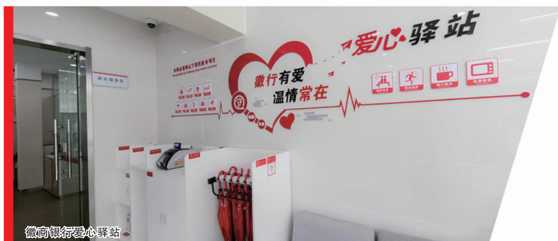
徽商银行爱心驿站