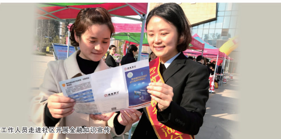
徽商银行工作人员走进社区开展金融知识宣传

为积极响应国家稳外贸稳外资政策要求,徽商银行开通便利化通道,创新“易系列”“出口e贷”线上产品,针对外贸企业加速落实一系列优服务、稳发展、促便利的金融服务及政策,服务外贸保稳提质,助力企业“出海”。