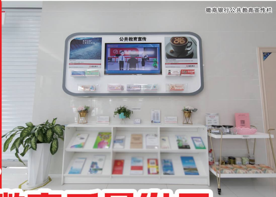
徽商银行公共教育宣传栏