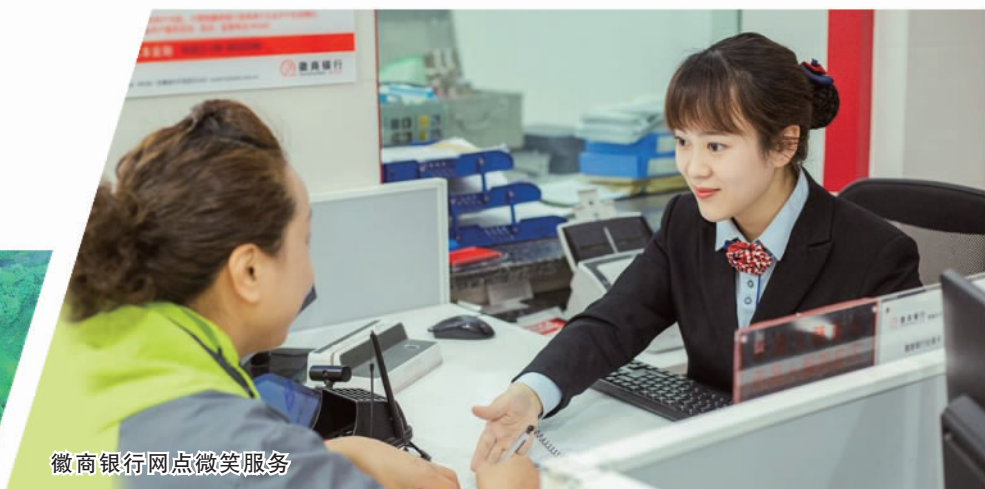
徽商银行网点微笑服务

2022年末,淮河能源控股集团有限责任公司拟在公开市场发行首笔债券,作为债券发行的主承销商,徽商银行迅速制定发行方案,7个工作日内完成重大事项排查、信息披露和簿记工作,助力该笔债券于2023年2月16日成功发行,发行规模10亿元。