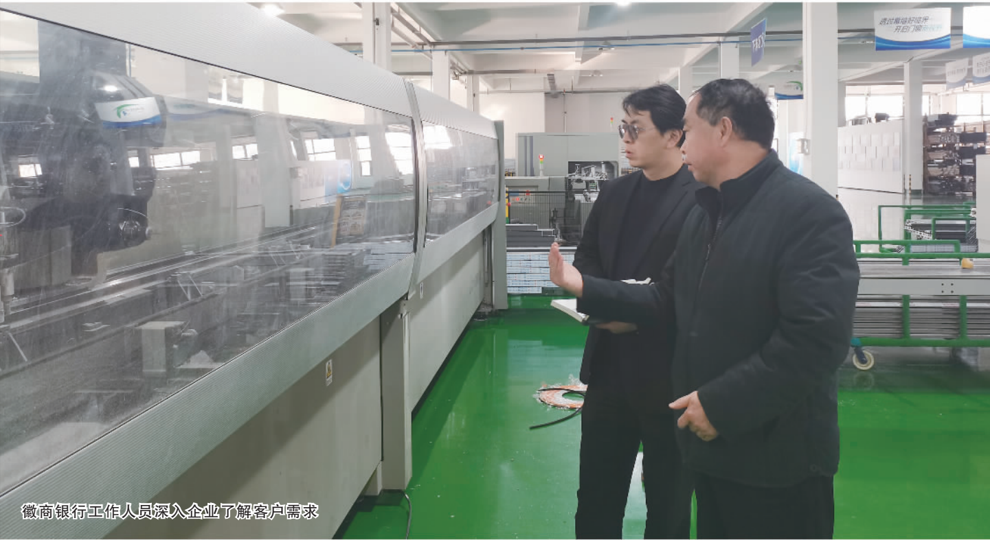
徽商银行工作人员深入企业了解客户需求