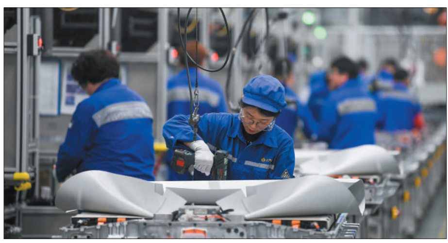
上图：在位于江苏常州溧阳的一家动力电池公司里，工人在车间进行电池生产。

一个社会幸福不幸福，很重要的还是看老年人幸福不幸福。近年来，全社会关心关爱老年人的力度持续加大。我们期待技术进步带来更多可能性，也期待全社会一起努力，携手打造更加友好的养老环境，让更多老年人安享幸福晚年。