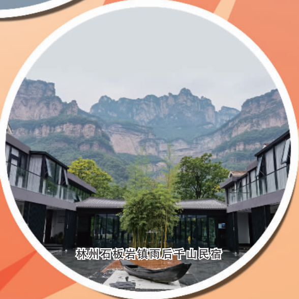
林州石板岩镇后千山民宿