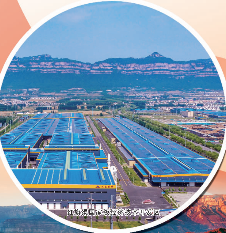
红旗渠国家级经济技术开发区