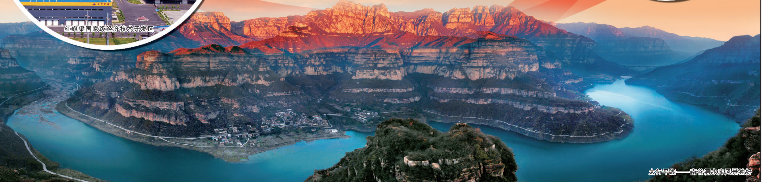
太行平湖——南谷洞水库风景独好