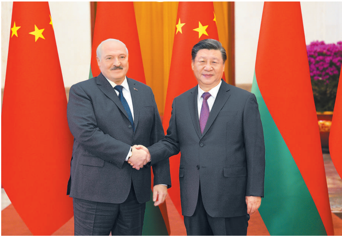
三月一日，国家主席习近平在北京人民大会堂同来华进行国事访问的白俄罗斯总统卢卡申科举行会谈。这是会谈前，习近平在人民大会堂北大厅为卢卡申科举行欢迎仪式。