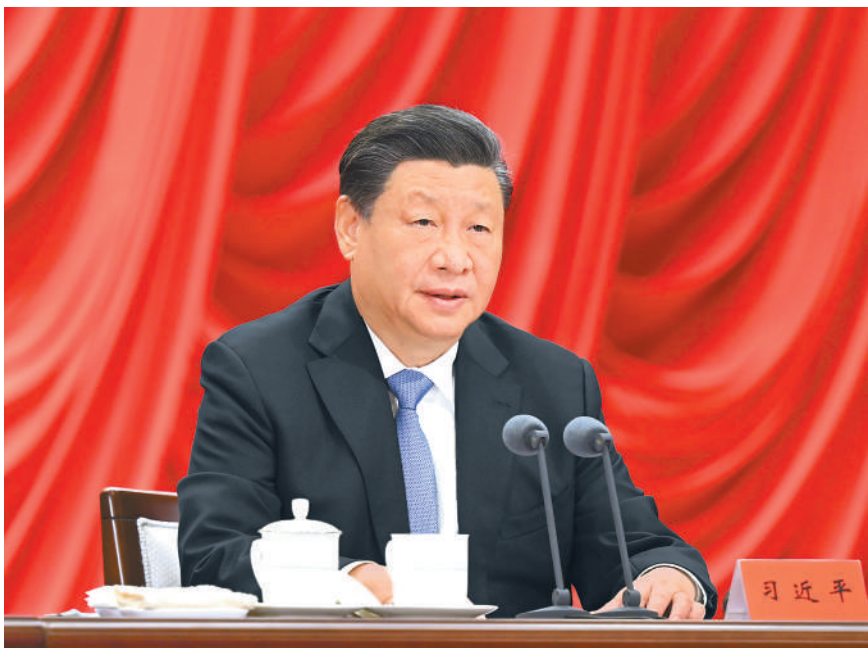
3月1日，中共中央党校建校90周年庆祝大会暨2023年春季学期开学典礼在北京举行。中共中央总书记、国家主席、中央军委主席习近平出席并发表重要讲话。