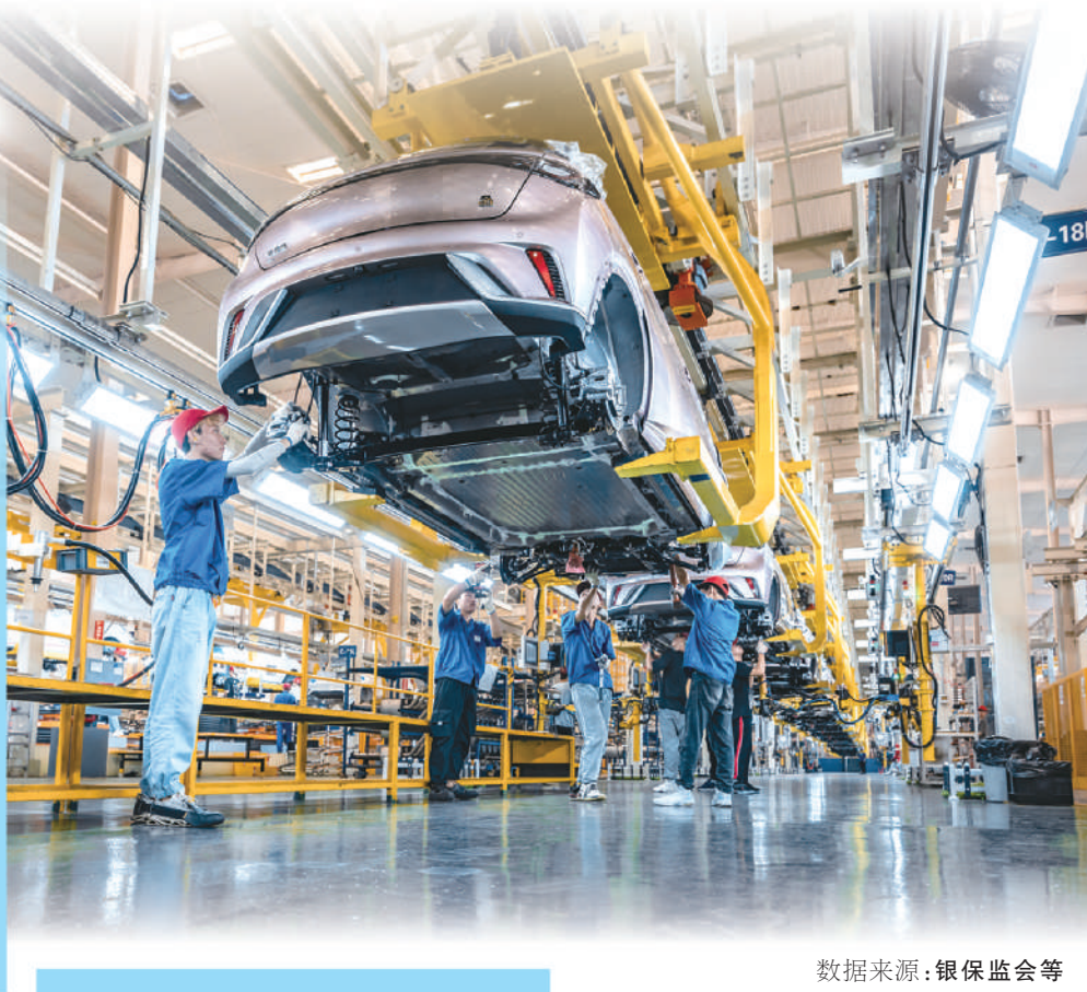
数据来源:银保监会等

“我们为温州一家新能源汽车企业提供了一年期1.5亿元的售后回租方案,并根据企业汽车销量逐步投放短期流动资金。”浙银租赁有关负责人说,该笔业务起到了示范作用,后期又有多家租赁公司给予该企业资金支持,助力企业生产经营保持良好态势。