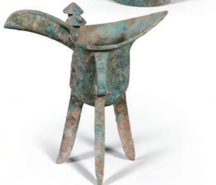
▲河南殷墟商王陵区及周边遗址出土的青铜觚与青铜爵。