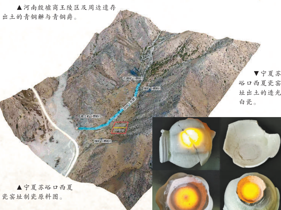
▲宁夏苏峪口西夏瓷窑址出土的透光白瓷。