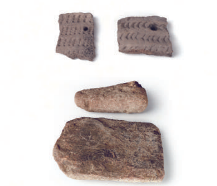
▲河北四台新石器时代遗址出土的戳印纹陶片、磨料与盘。