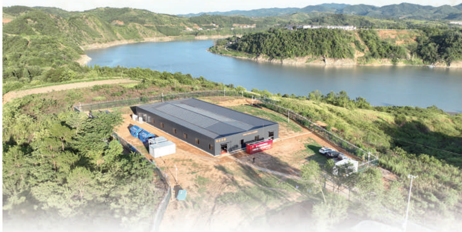
▲湖北学堂梁子旧石器时代遗址考古方舱。

北京大学考古文博学院教授张弛用了许多“不可思议”来形容甘肃庆阳南佐遗址。600万平方米以上的规模，相当于两个二里头、两个良渚古城、一个半石峁，几乎是北方地区商代以前单体量