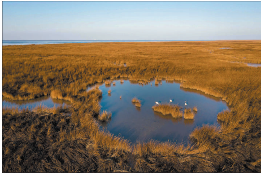
上图：位于山东省东营经济技术开发区的一片湿地。

时代在发展，科技也在进步。以前巡检，大部分线路都要依靠人工目视完成，经常要背着照相机、望远镜，天不亮就出发，一走就是一天。随着新技术的运用，输电线路巡检也进入了智能化、数字化的时代。如今，我们成立了智能化巡检小组，我也成为单位第一批超视距驾驶员。通过采用无人机和直升机巡检，无论是在一望无际的原野，还是在人迹罕至的深山，我们都能准确排查线路问题。搭载激光扫描仪的无人机还能进行“点云采集”，形成激光三维模型，建立“三维一体”的信息库。这让我们告别了人工手持测距仪的繁重，高压输电线路检修工作也迈上了新的台阶。