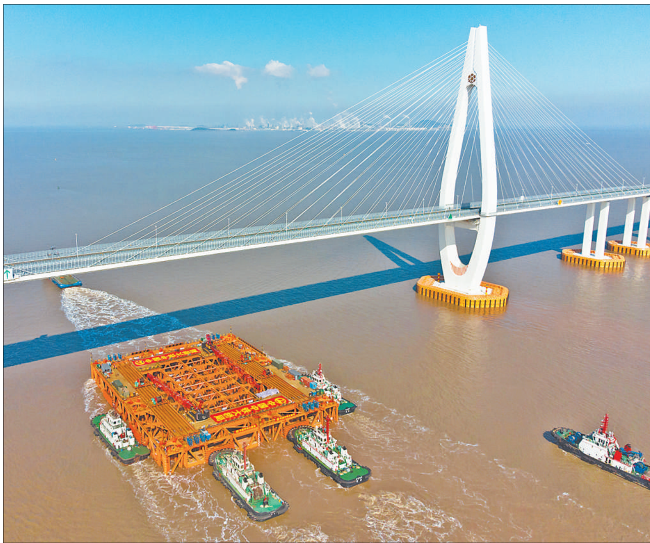
2月16日，浙江甬舟铁路西堠门公铁大桥5号墩自浮式钻孔平台通过舟岱大桥主通航孔。当日，5号墩自浮式钻孔平台浮运到位，标志着大桥主塔墩基础建设拉开序幕。

西堠门公铁两用大桥是甬舟铁路及甬舟高速公路复线的共用跨海桥梁，是全线关键性控制工程。