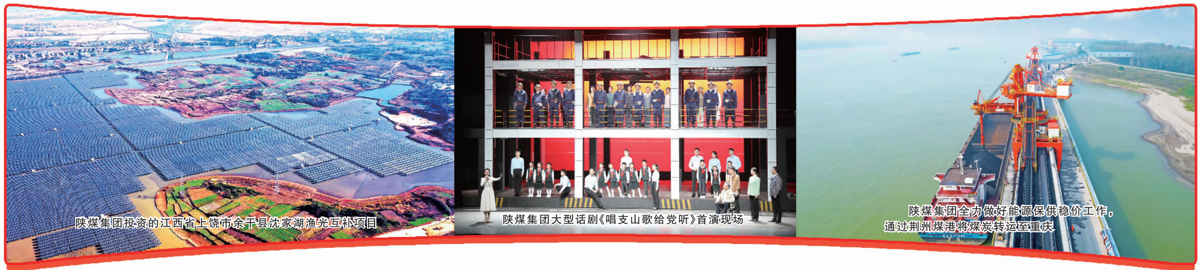
陕煤集团投资的江西省上饶市余干县沈家湖渔光互补项目

同时,陕煤集团加速智慧矿山、智能工厂建设,真正让数字化、智能化成为“改变陕煤形象、奠定陕煤地位、保持陕煤领先”的有力支撑。目前,7处国家首批智能化示范煤矿通过国家验收,5个智慧矿区、28处智能化矿井和全国煤炭行业首个“5G+智慧矿山”培训基地顺利建成,研发应用智能快掘系统76套、智能机器人198个,智能化产能占比达99%。2022年8月12日,