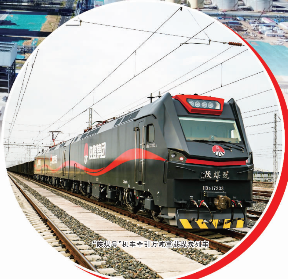
“陕煤号”机车牵引万吨重载煤炭列车

2013年至今,陕西煤业化工集团有限责任公司(简称“陕煤集团”)规模体量持续保持大幅增长,资产总额从3485亿元到7200亿元,增长约1.1倍;营业收入从1500亿元到5102亿元,增长约2.4倍;利润总额从13.7亿元到603亿元,增长约43倍。