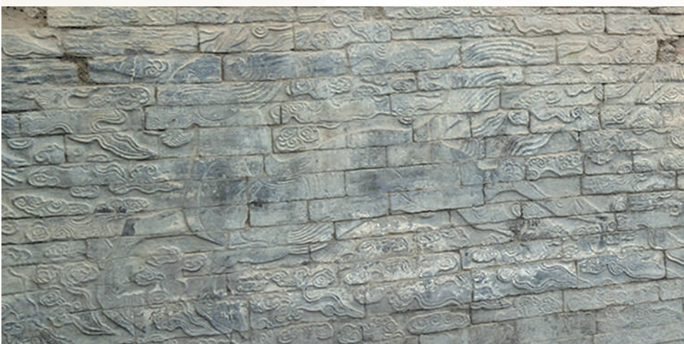
▲明代州桥复原图。▼州桥石壁上的北宋浮雕壁画。