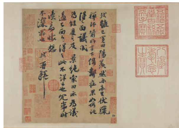
《高山仰止 回望东坡——苏轼主题文物特展》展出的苏轼真迹《阳美帖》。