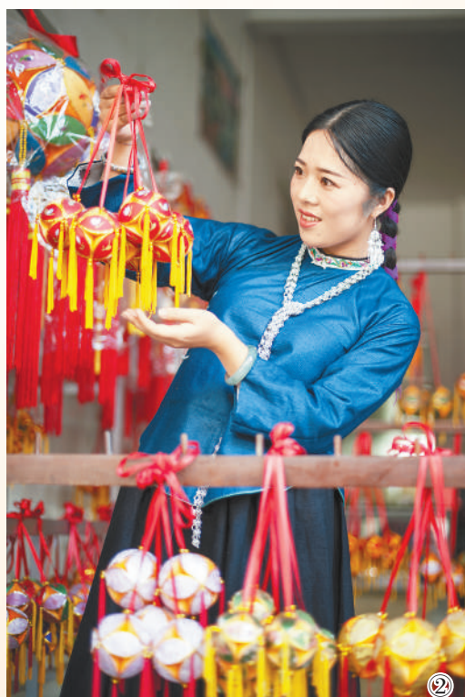
图①：山村远眺。 赵京武摄(人民视觉) 图②：选购绣球。 赵京武摄(人民视觉) 图③：制作绣球。 赵京武摄(人民视觉)