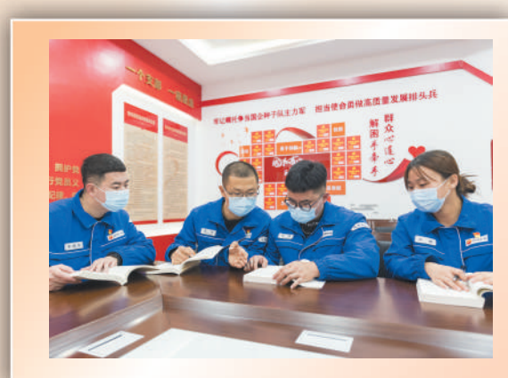
▲记者在辽阳石化采访时，企业员工在集体研学党的二十大精神。