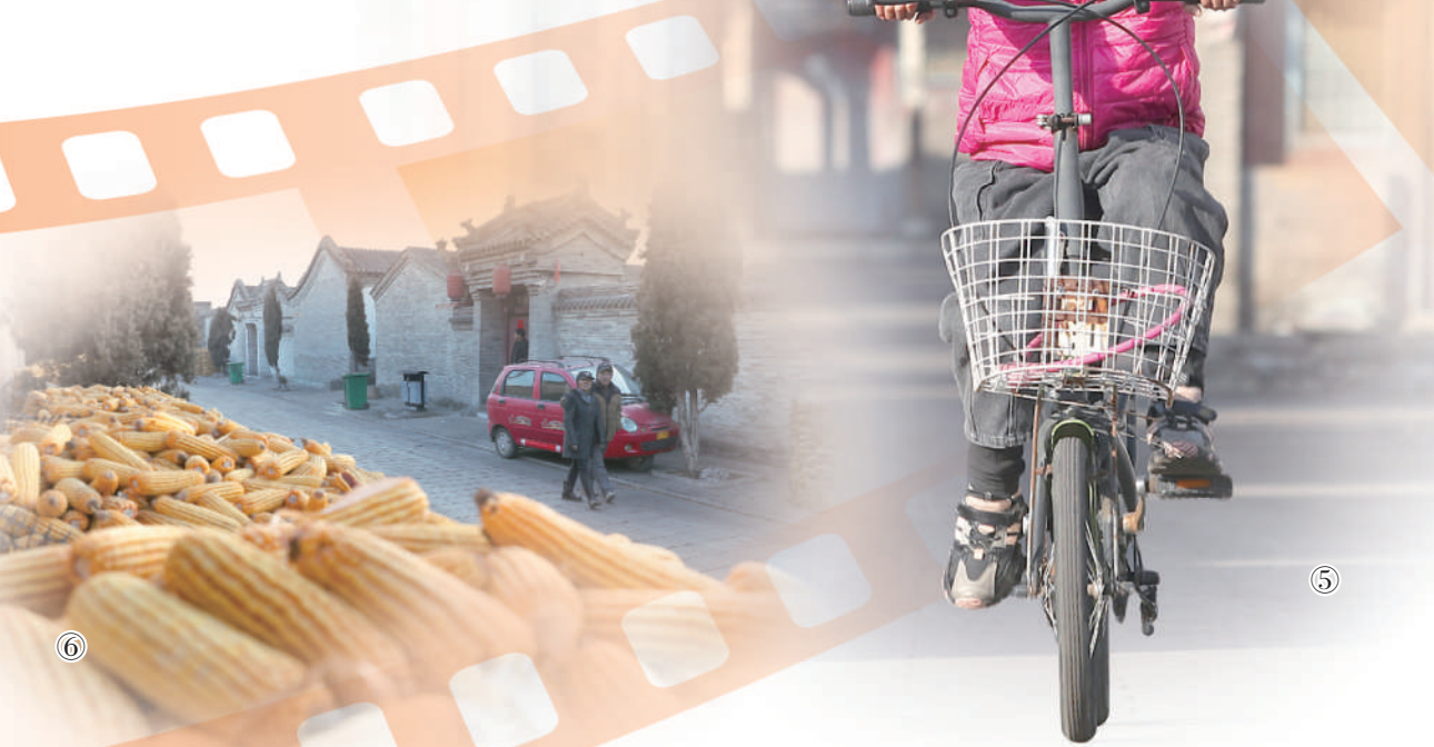
图⑤:小朋友在北方城村内的主街道上骑车。