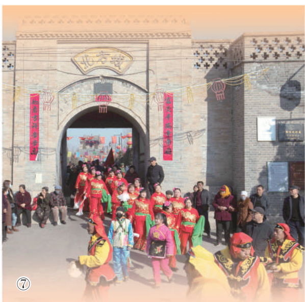
图⑦:北方城村社火队在村内南堡门进行社火表演。

侧是成排分布的古民居。每栋古民居都设有天井,天井既具有采光、通风的功能,又能汇聚屋面的雨水,雨水顺着水视纳入天井之中,名曰“四水到堂”或“四水归明堂”。天井的正下方或侧边设有一尺多深的支暗沟,每条支暗沟均与巷子里的主暗沟相通。由于主暗沟比支暗沟深很多,因而支暗沟的水能够很顺利地注入主暗沟而不会回流。村中有八口水塘,中间面积较大的称为“月塘”,环绕“月塘”的是七口面积略小的水塘,形成“七星伴月”之象。村里各条巷子的主暗沟均与水塘相通,且利用自然落差将雨水自北向南注入相应的水塘之中。而八口水塘也设有暗沟,水漫到相应高度,多余的水则通过暗沟顺着地势流向村前的河流。因而,不论下多大的雨,村中从未出现过积水或水淹现象。(本报记者周欢采访整理)