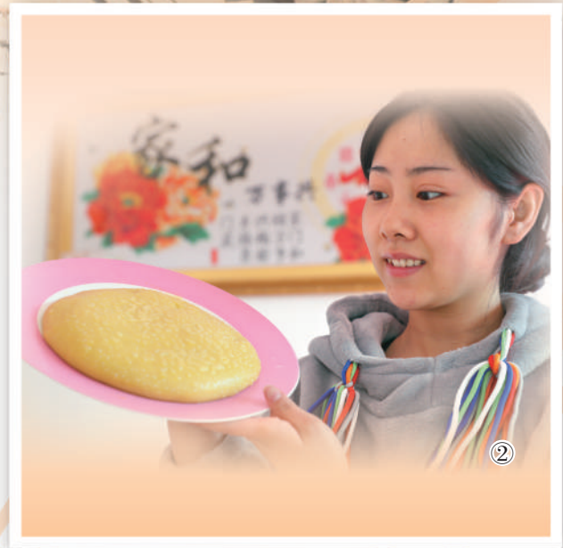
图②:村民展示刚刚做好的蔚县传统美食黄糕。

行走于古堡内,随处可见灵动活泼的砖雕、木雕、石雕、匾额等装饰。兽首花草、祈福图案等被用在建筑的墙脊、照壁、瓦当等显眼部位。窗户、门框上有狮子滚绣球、福字等木