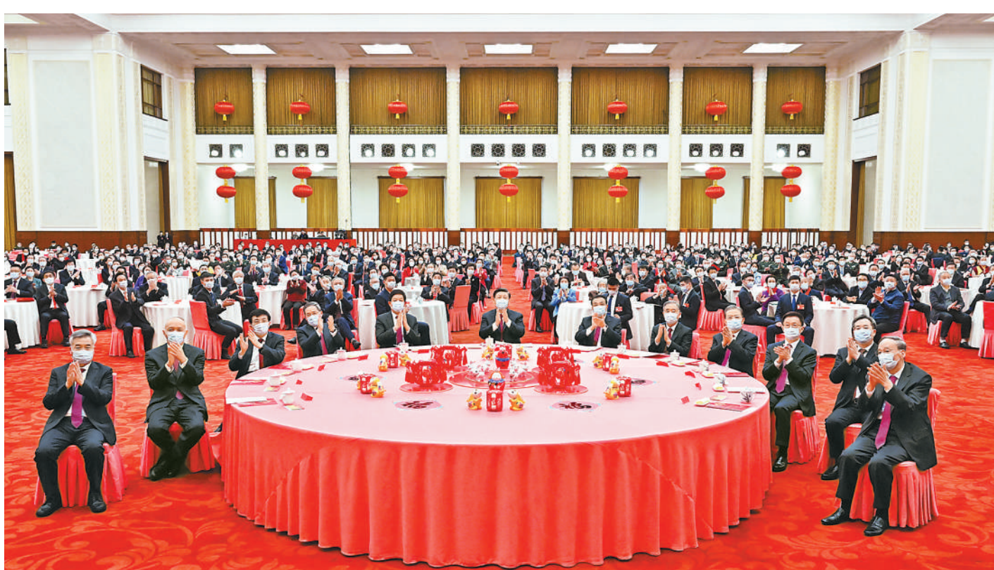
1月20日,中共中央、国务院在北京人民大会堂举行2023年春节团拜会。党和国家领导人习近平、李克强、栗战书、汪洋、李强、赵乐际、王沪宁、韩正、蔡奇、丁薛祥、李希、王岐山等同首都各界人士齐聚一堂,共迎新春。