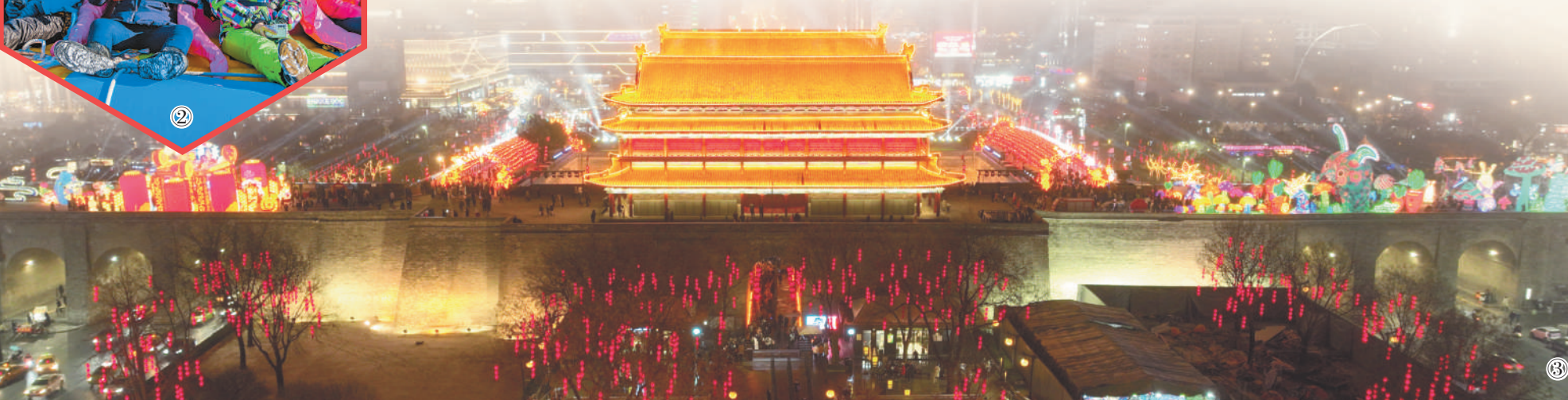
图③:1月14日,西安城墙新春灯会吸引众多游客登城墙赏花灯。