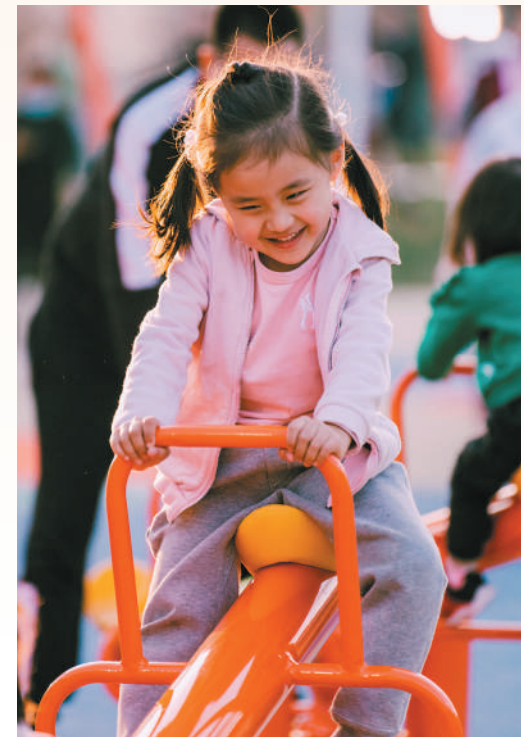
广东省惠州市惠湾地区体育公园建成后,周边群众运动休闲更方便。图为小朋友在公园游玩。

本版策划:王军 杨旭 本版责编:刘念 许诺 史哲 张帅祯 赵政 常晋 版式设计:张芳曼