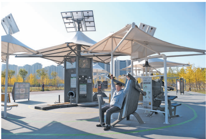
辽宁省沈阳市丁香东湖智慧体育公园实现了健身服务智能化供给,成为全民健身新载体。