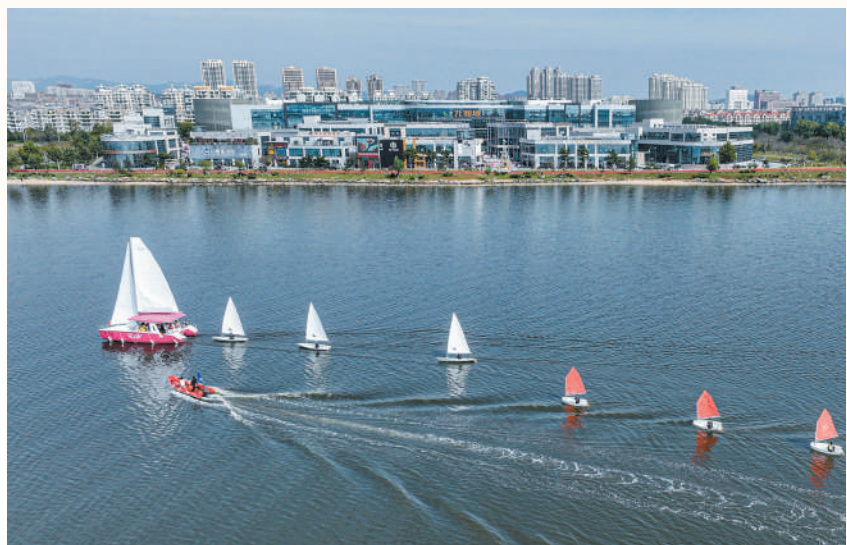
山东省荣成市樱花湖体育公园经过环境综合改造提升,已成为“全民参与型”休闲体育运动主题公园。图为该体育公园水上运动体验区。