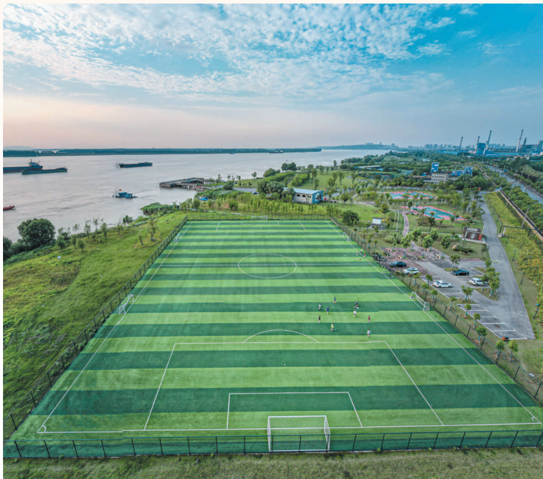
安徽省铜陵市滨江生态体育公园由废旧码头改造而成,现已成为市民健身、运动休闲的场所。图为市民在公园球场上运动。