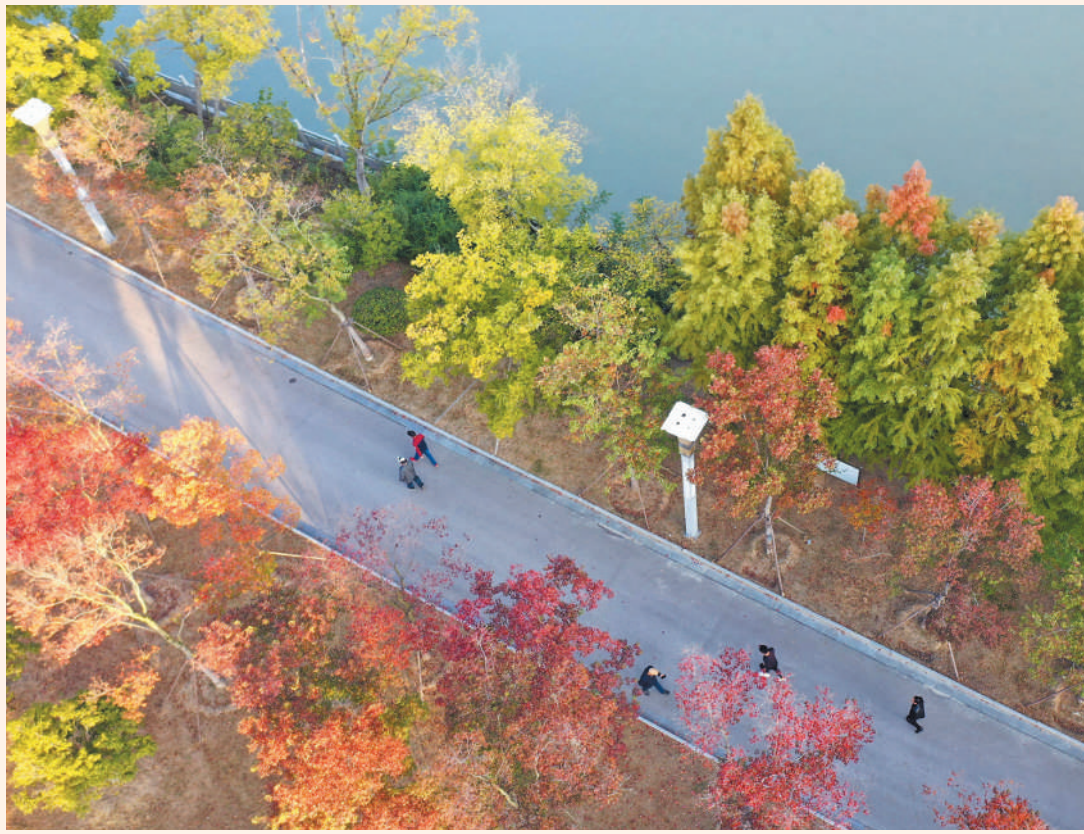
江苏省扬州市宝射河休闲体育公园美景怡人,吸引市民前来徒步赏景。

习近平总书记强调:“要紧紧围绕满足人民群众需求,统筹建设全民健身场地设施,构建更高水平的全民健身公共服务体系。”