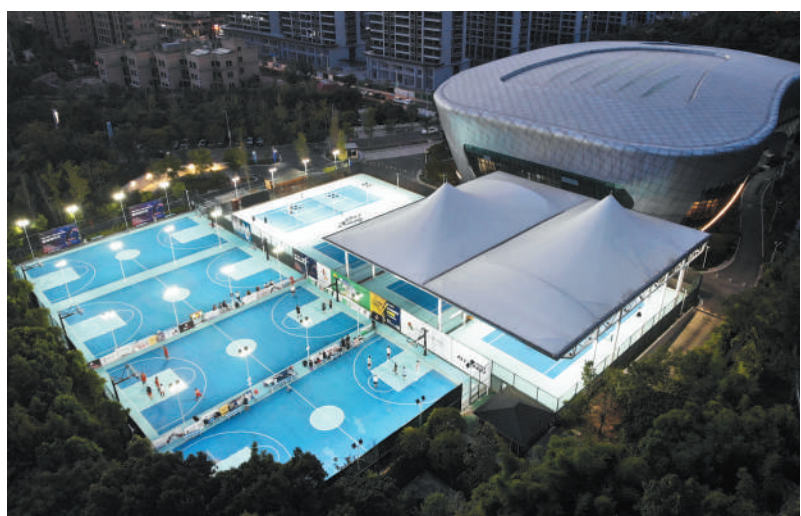
浙江省台州市市民在中央山体育公园体育场运动。