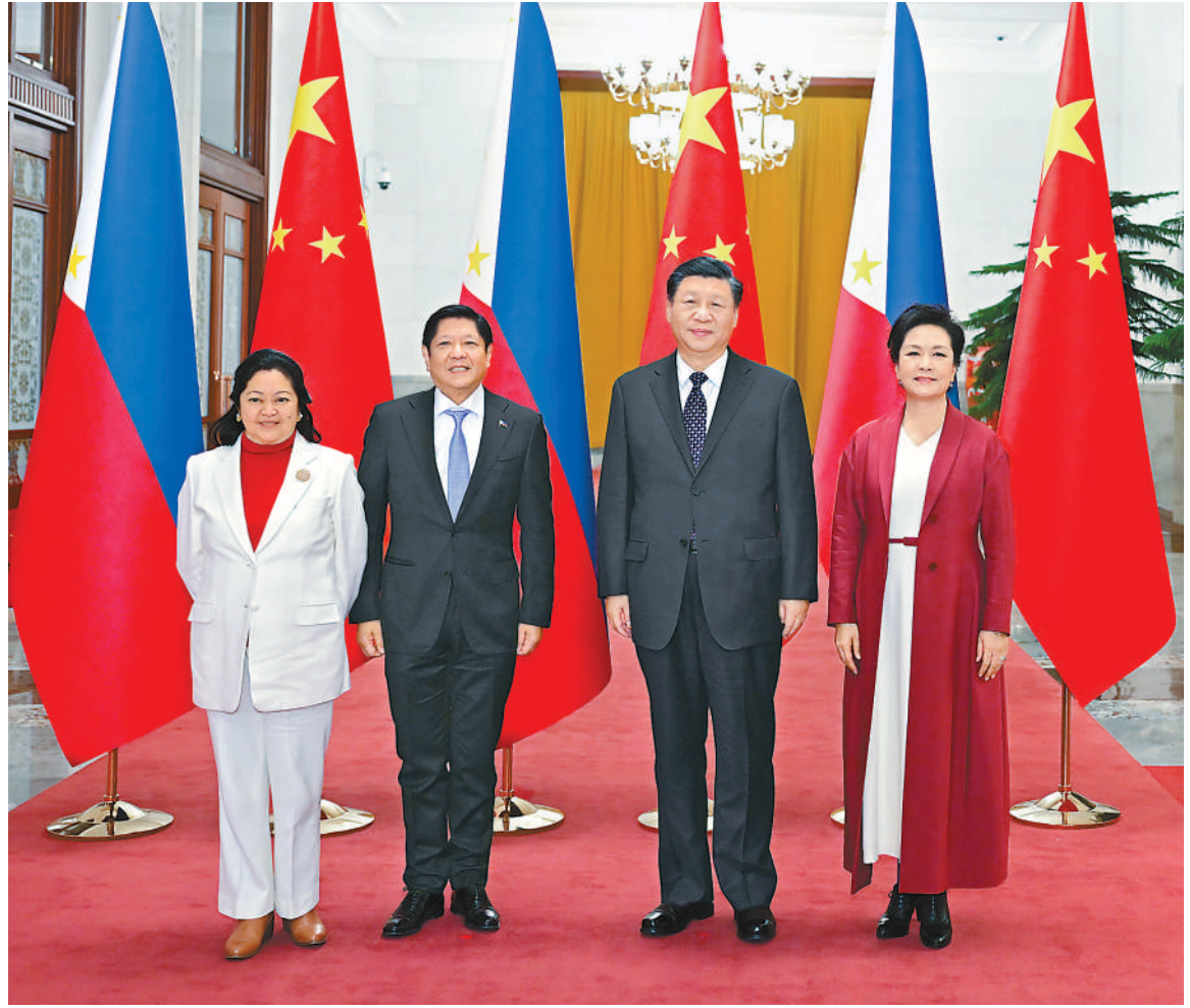
一月四日，国家主席习近平在北京人民大会堂同来华进行国事访问的菲律宾总统马科斯举行会谈。会谈前，习近平在人民大会堂北大厅为马科斯举行欢迎仪式。这是习近平和夫人彭丽媛同马科斯和夫人丽莎合影。