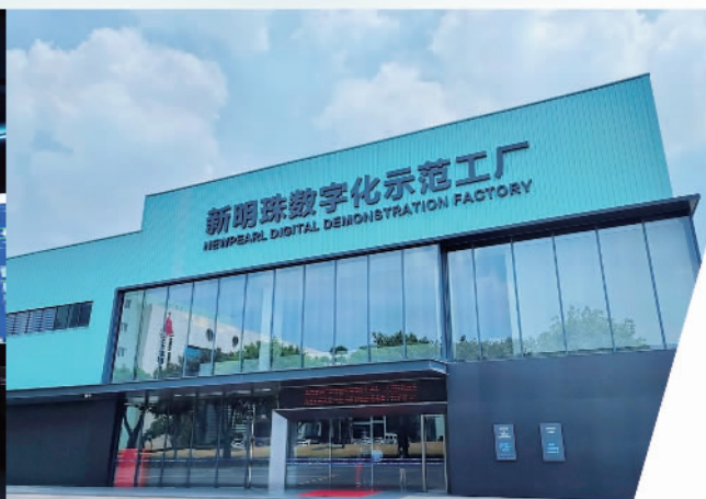
新明珠数字化示范工厂