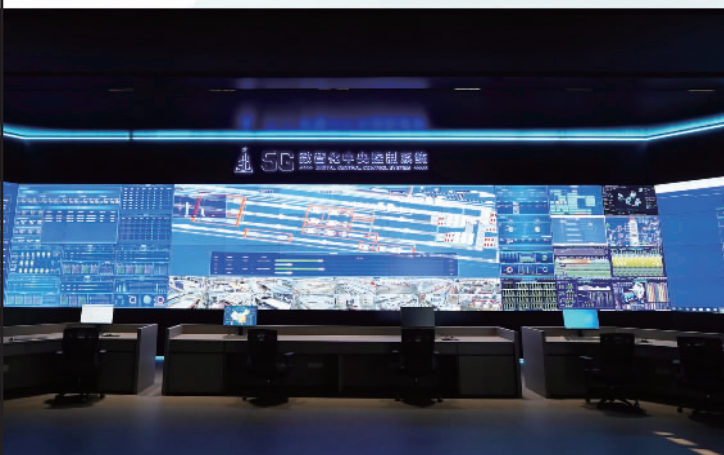
新明珠5G数字化中央控制系统