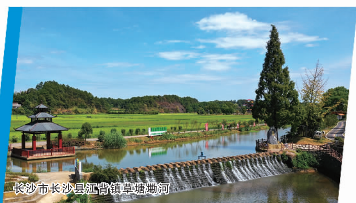
长沙市长沙县江背镇草塘湖

呵护小微水体,改善乡村水环境。 沟渠塘堰等小微水体是江河湖库的“毛细血管”,散布在广大乡村。在治理大江大河的同时,长沙市打出小微水体整治“组合拳”。通过全面开展小微水体调查,登记小微水体16.02万余处,在此基础上进行划片分区管理,明确片区河长3941名,实现每个水体都有“监护人”。按照“市级补贴+县级配套+社会参与”的模式,每年投入8000万元用于小微水体补助,共打造90个小微水体管护示范片区,以点带面促进全市农村人居环境改善。通过大小同治,全市国控、省控地表水考核断面平均水质优良率已连续三年达100%,湘江、浏阳河、捞刀河稳定达到Ⅲ类水质以上,达到有监测记录以来水质最好的水平。