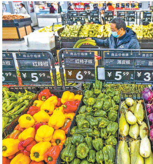
河北遵化一家超市里，顾客在选购蔬菜。

精准施策帮扶重点群体，筑牢就业“稳定器”。推动公共就业服务进校园，对离校未就业毕业生提供实名制服务，推进百万就业见习岗位募集计划，为高校毕业生生物通就业路；开展“春风行动”，深化东西部劳务协作，规范化建设零工市场，力促农民工就业稳定。 (本报记者 李心萍)