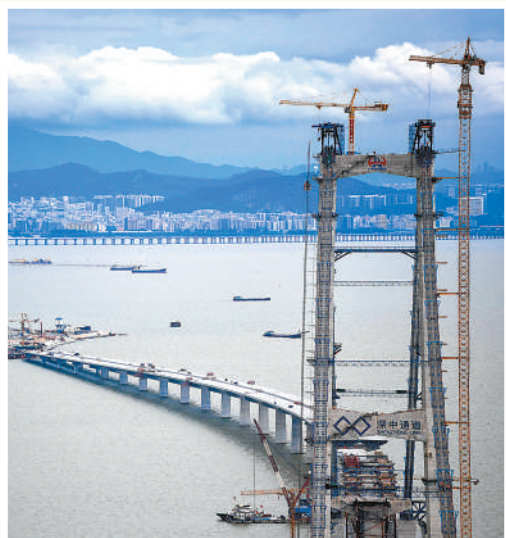
正在建设中的深中通道伶仃洋大桥。

投资结构持续优化。前11月，高技术产业投资同比增长19.9%，比全部投资增速高14.6个百分点。民生补短板投资增长较快，各方面持续加大教育、文化、医疗等公共领域投入。前11月，社会领域投资同比增长12.5%。 (本报记者 陆娅楠)