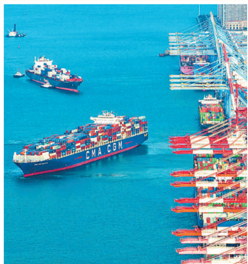
山东港口集团青岛港前湾集装箱码头船来船往，装卸繁忙。

韧性来自于外贸主体的活力释放。前11月，全国有进出口实绩的民营企业49.75万家，合计进出口19.41万亿元，同比增长13.6%，占同期我国外贸总值的50.6%。一系列助企纾困政策措施先后出台，有力激发了外贸企业活力。 (本报记者 罗珊珊)