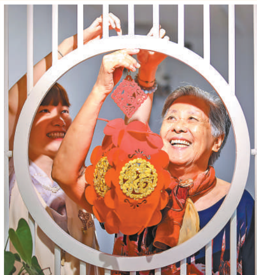
福建福州鼓楼区安泰街道，老人和社区工作者一起悬挂花灯。

加强价格监测监管，切实兜牢民生底线。各地认真执行阶段性调整价格补贴联动机制，截至11月底，今年累计发放价格临时补贴约60亿元。 (本报记者 陆娅楠)