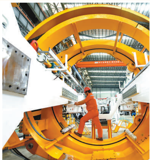
浙江中铁装备盾构机生产基地，工人在安装新型盾构机的部件。

目前，我国重点培育的国家级先进制造业集群增至45个，拥有近9000家专精特新“小巨人”企业，覆盖新一代信息技术、高端装备、新材料、生物医药等制造强国建设重点领域，由点及线到面的国家制造业创新体系加速建设。 (本报记者 韩鑫)