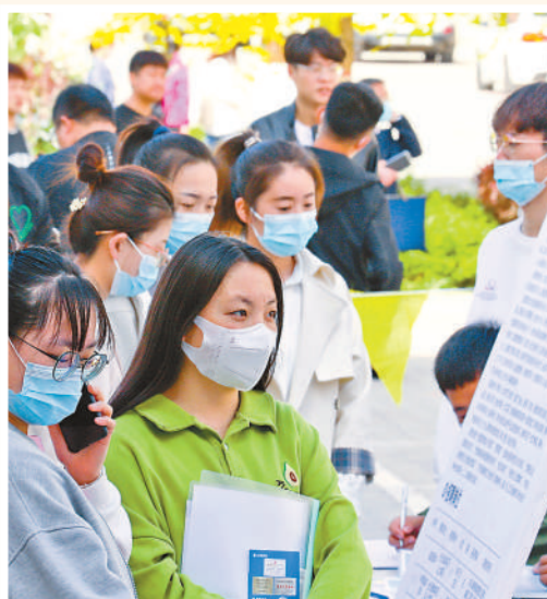
甘肃张掖，大学毕业生在专场招聘活动现场浏览招聘信息。