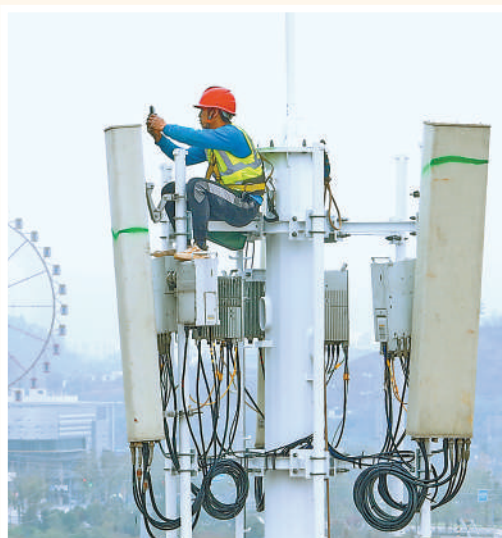
江西赣州蓉江新区，技术人员在安装调试5G信号设备。

“十四五”时期，我国将基本完成2000年底前建成的约21.9万个城镇老旧小区的改造任务，助力更多居民从住有所居迈向住有优居。 (本报记者 丁怡婷)