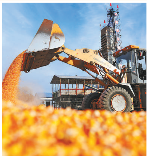
黑龙江北大荒农垦集团赵光农场，铲车在晒场倾卸玉米。

大国粮仓根基稳固，为稳定宏观经济大盘、保持经济运行在合理区间提供了有力支撑。 (本报记者 常钦)