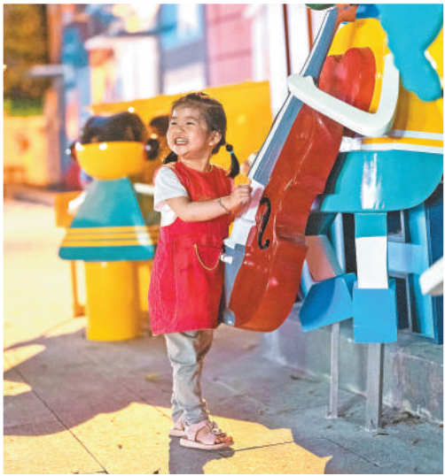
重庆大渡口区新山村街道，小朋友在改造后的社区广场玩耍。

改革取得新突破。今年，基本养老保险全国统筹大幕开启，截至目前已调拨全国统筹调剂资金2440亿元，支持基金困难省份养老金发放；人社部牵头主导的第三支柱个人养老金制度启动实施……一件件一桩桩都是我国养老保险事业发展中具有里程碑意义的标志性事件。 (本报记者 李心萍)