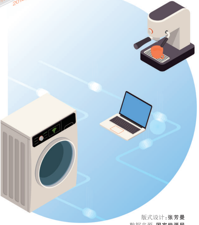
版式设计：张芳曼 数据来源：国家能源局