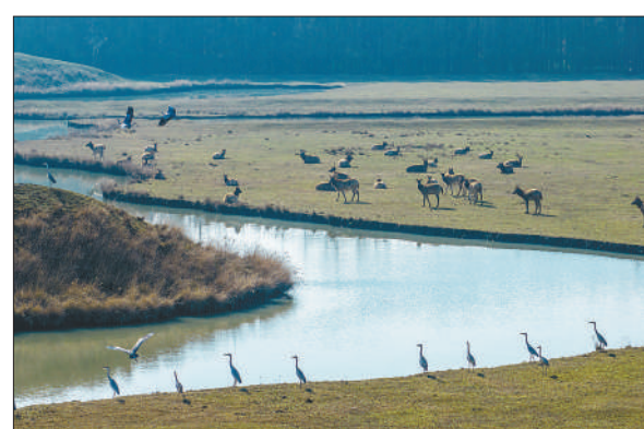
左图:在江苏省泰州市姜堰区溱湖国家湿地公园,成群的麋鹿和候鸟在湿地休憩。