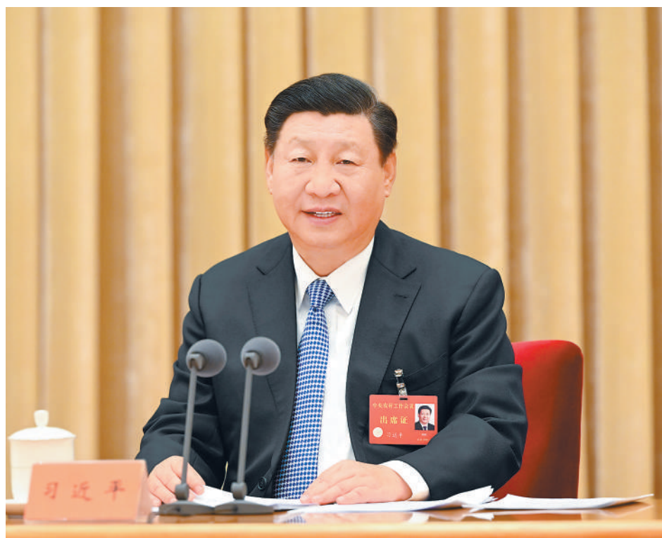
12月23日至24日，中央农村工作会议在北京举行。中共中央总书记、国家主席、中央军委主席习近平出席会议并发表重要讲话。

习近平强调，要依靠科技和改革双轮驱动加快建设农业强国。要紧盯世界农业科技前沿，大力提升我国农业科技水平，加快实现高水平农业科技自立自强。要着力提升创新体系整体效能，解决好各自为战、低水平重复、转化率不高等突出问题。要以农业关键核心技术攻关为引领，以产业急需为导向，聚焦底盘技术、核心种源、关键农机装备等领域，发挥新型举国体制优势，整合各级各类