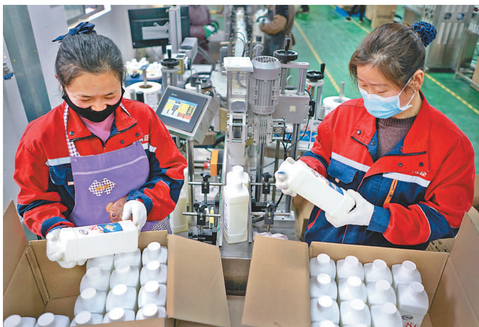
▲虞城县能臣家居公司的安检员正在检测产品质量。