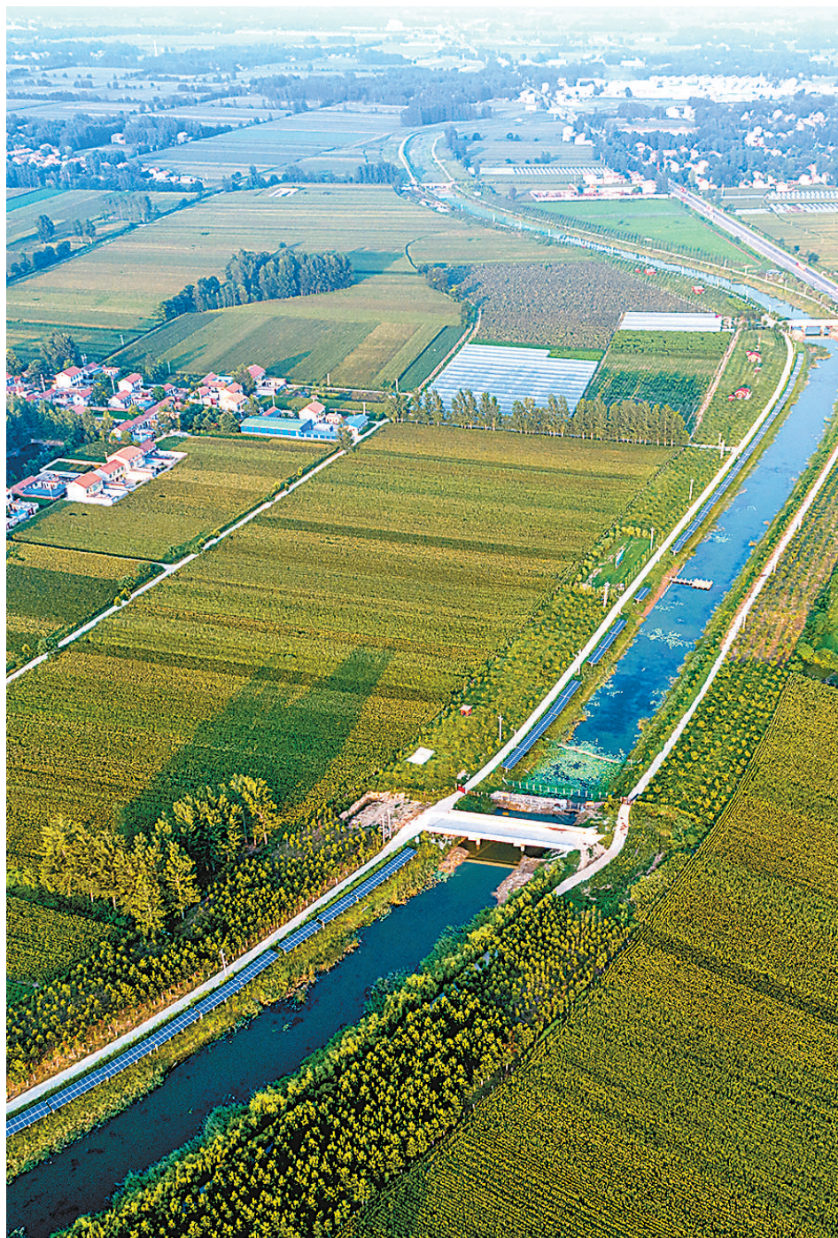
▲虞城县稍岗镇韦店集村打造的“十里画廊”景点。