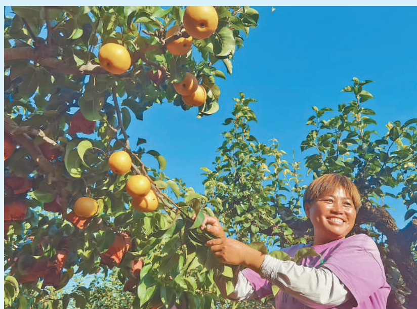
▲虞城县田庙乡果农在忙着采摘圆黄梨。