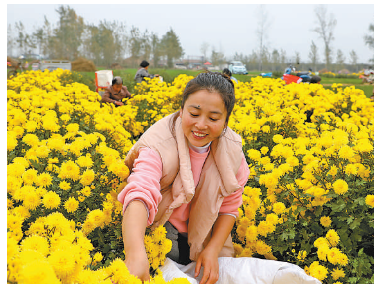
▲虞城县刘店乡村民在采摘菊花。