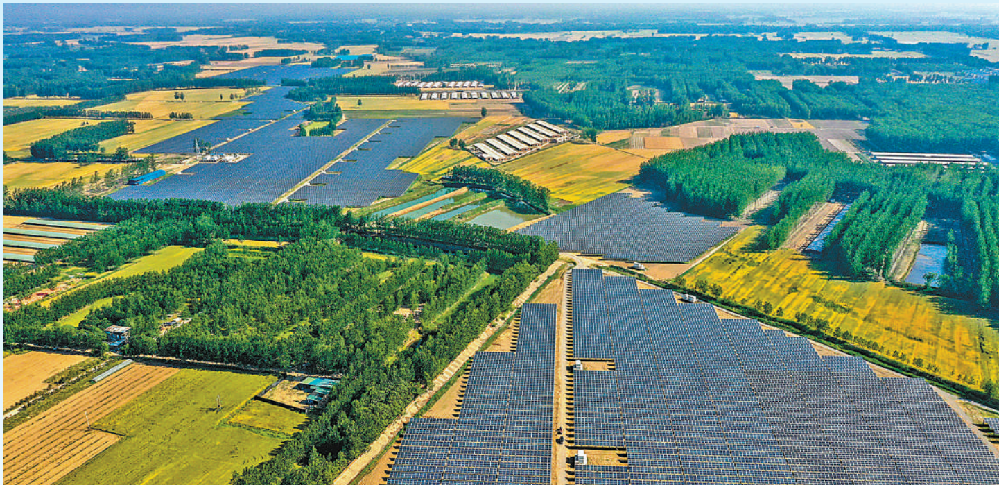
▲虞城县乔集镇大力发展光伏产业助力村民增收。

习近平总书记指出,“全面推进乡村振兴”“坚持农业农村优先发展,坚持城乡融合发展,畅通城乡要素流动”“扎实推动乡村产业、人才、文化、生态、组织振兴”。