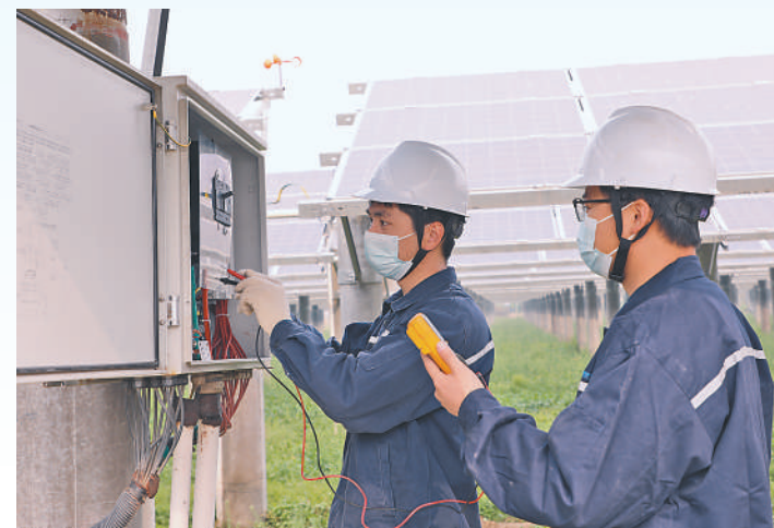
▲虞城县利民镇光伏产业基地员工在进行安全检查。