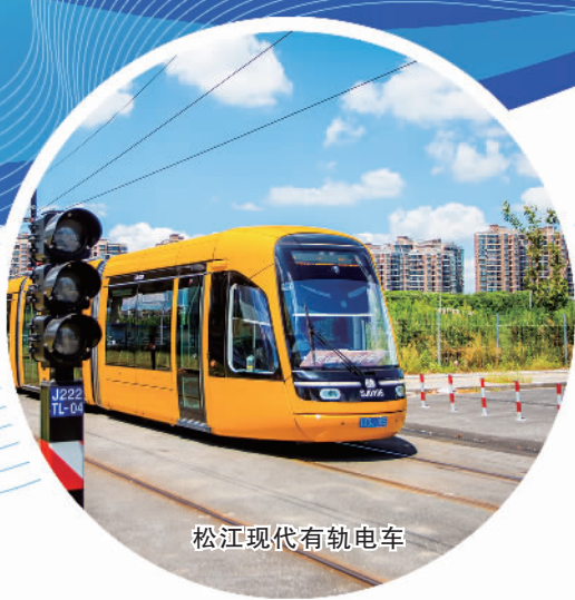
松江现代有轨电车

松江区是上海市的西南门户。G60科创云廊光影璀璨，广富林文化遗址历史厚重，浦江之首碧波荡漾，大学城内青春飞扬。当前，松江区正全力推进长三角G60科创走廊、松江新城和松江枢纽“三张王牌”建设。