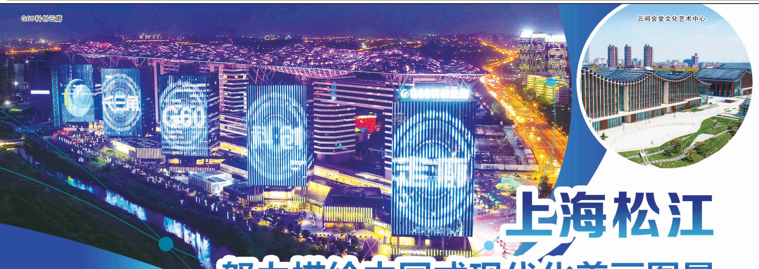
云间会堂文化艺术中心