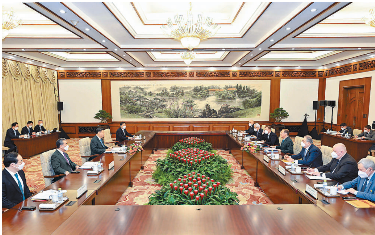
12月21日,中共中央总书记、国家主席习近平在北京钓鱼台国宾馆会见应中国共产党邀请访华的俄罗斯统一俄罗斯党主席梅德韦杰夫。

本报北京12月21日电 12月21日,中共中央总书记、国家主席习近平在钓鱼台国宾馆会见应中国共产党邀请访华的俄罗斯统一俄罗斯党主席梅德韦杰夫。 习近平请梅德韦杰夫转达对普京总统的亲切问候和良好祝愿,指出中共二十大明确了全面建成社会主义现代化强国、以中国式现代化全面推进中华民族伟大复兴的中心任务。我们有充足底气、充分信心走好中国式现代化之路,也为世界和平与繁荣提供更多机遇。中国共产党和统一俄罗斯党长期开展机制化交往,成为巩固中俄政治互信、推进两国互利合作、展现两国战略协作的独特渠道和平台,为新时代中俄关系行稳致远提供了有力支撑。当前,中俄执政党交往迈入“第三个10年”。希望两党继续围绕治国理政经验、促进发展战略对接、推动政党国际多边合作