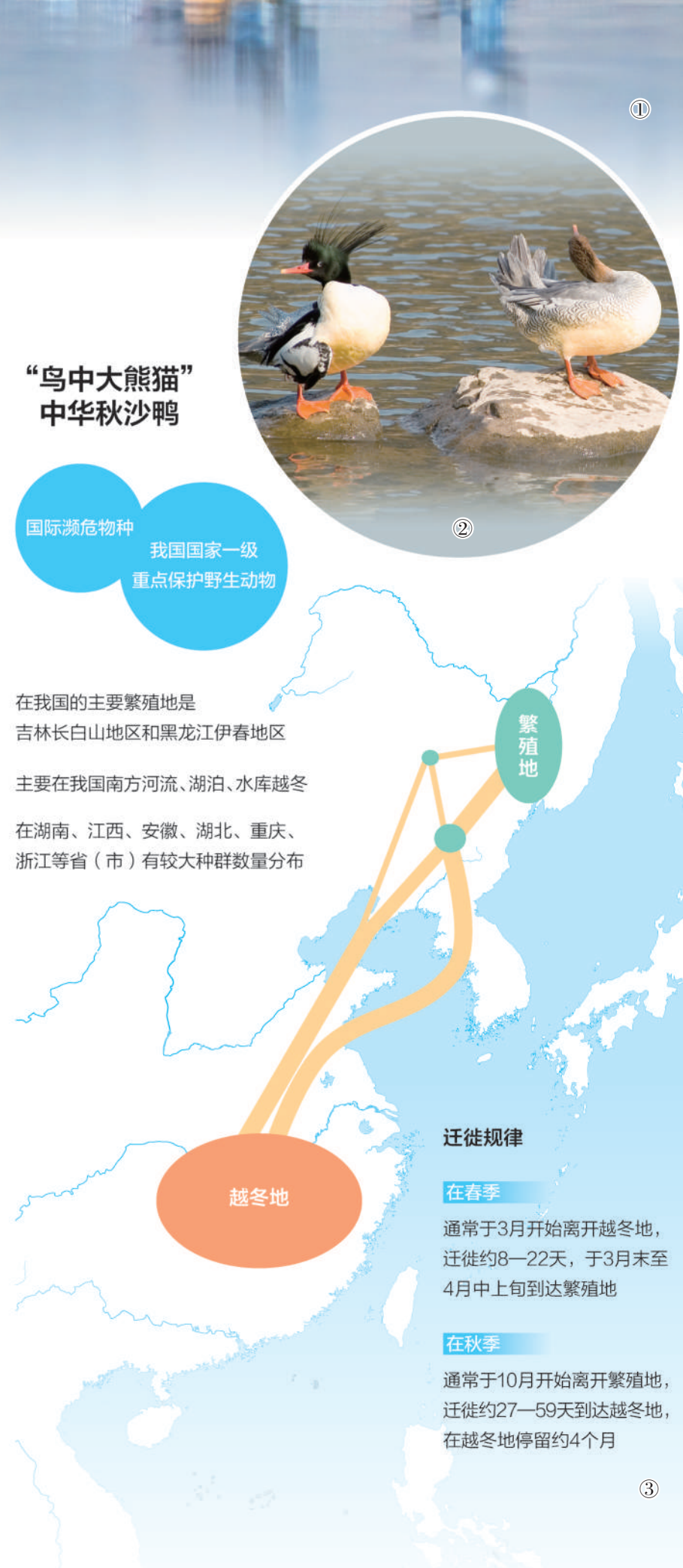
图①：山东省临沂市郯城县沂河马头段，中华秋沙鸭振翅欲飞。 房德华摄 图②：江西省鹰潭市龙虎山景区泸溪河，一雌一雄两只中华秋沙鸭在休憩。肖冬样摄 图③：中华秋沙鸭在我国的主要繁殖地和越冬地示意图。 资料来源：全国鸟类环志中心 图④：江西省鹰潭市龙虎山景区泸溪河，生态护林员肖冬样在观察中华秋沙鸭。 严米金摄 图⑤：安徽省黄山市新安江源头，中华秋沙鸭沐浴在阳光下。 朱国平摄