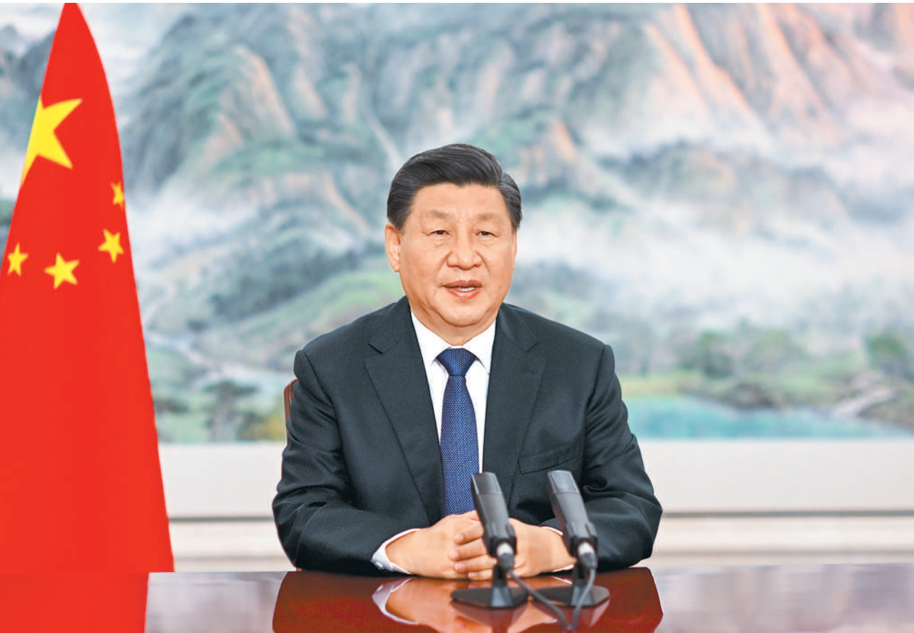
12月15日晚,国家主席习近平以视频方式向在加拿大蒙特利尔举行的《生物多样性公约》第十五次缔约方大会第二阶段高级别会议开幕式致辞。

新华社北京12月15日电 12月15日晚,国家主席习近平以视频方式向在加拿大蒙特利尔举行的《生物多样性公约》第十五次缔约方大会第二阶段高级别会议开幕式致辞。