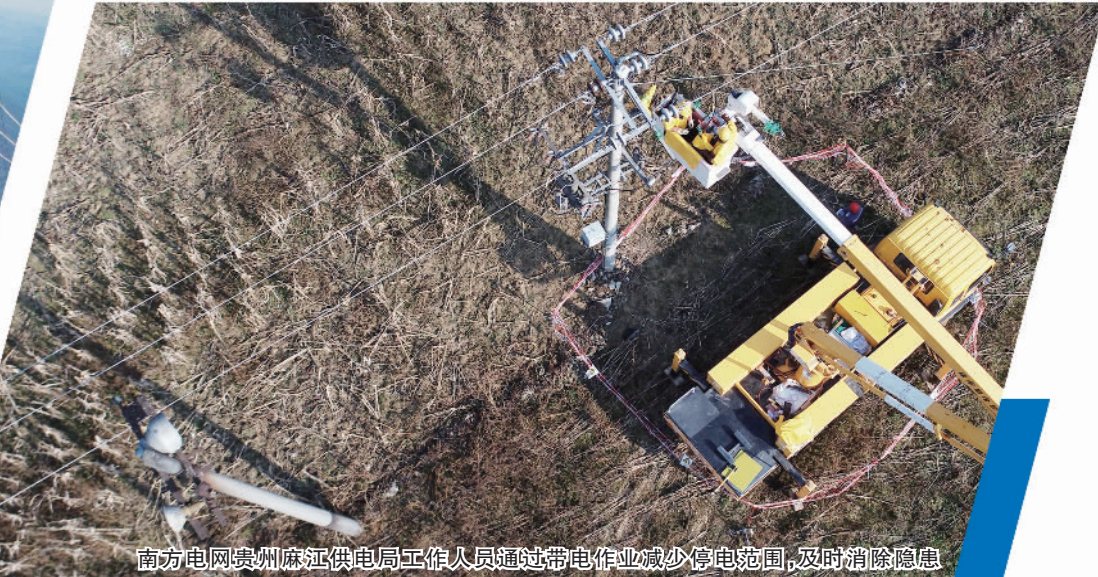
南方电网贵州麻江供电局工作人员通过带电作业减少停电范围，及时消除隐患