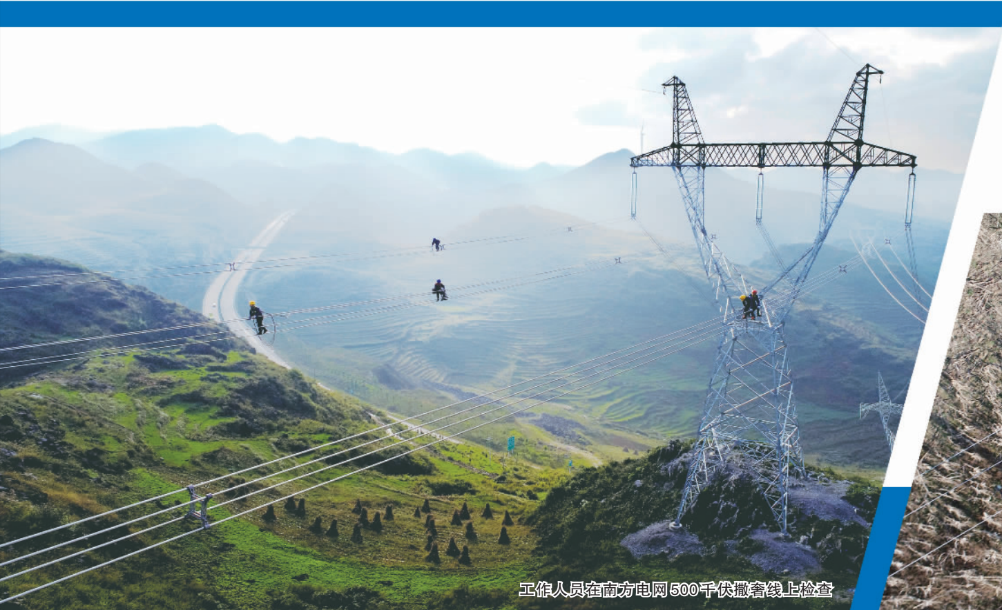
工作人员在南方电网500千伏撒翁线上检查