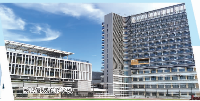
民心港人子弟学校