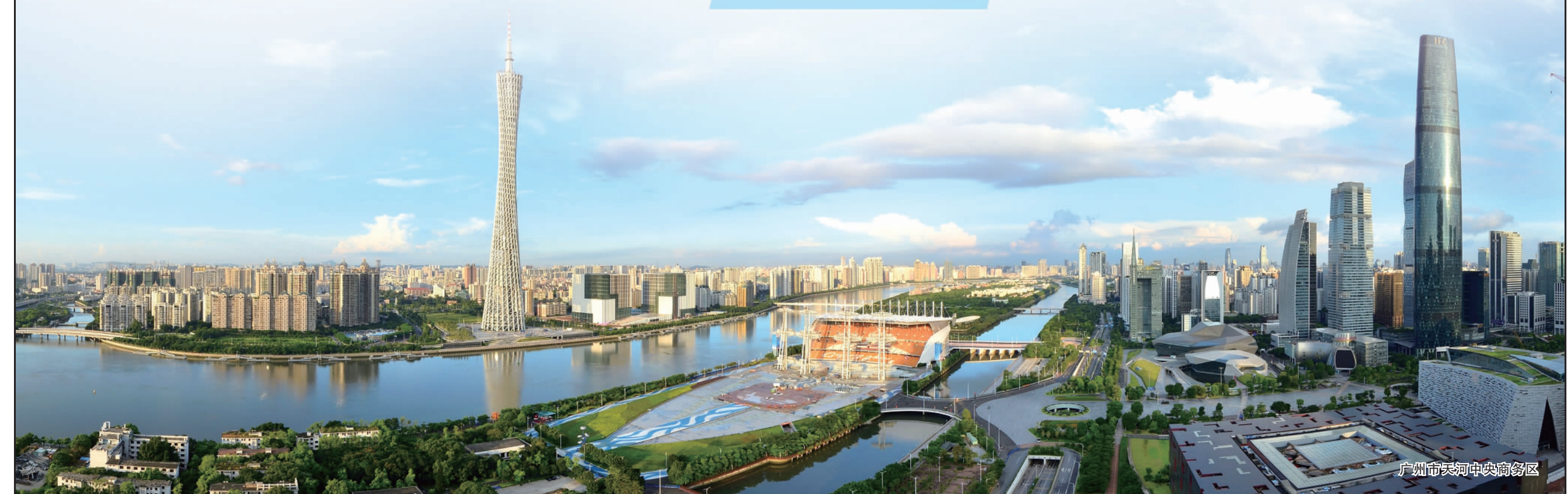
广州市天河中央商务区