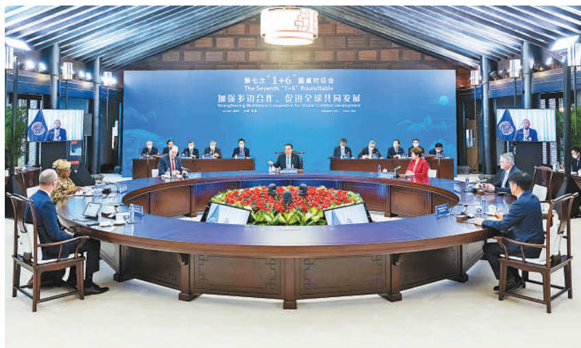
12月9日，国务院总理李克强在安徽省黄山市同世界银行行长马尔帕斯、国际货币基金组织总裁格奥尔基耶娃、世界贸易组织总干事伊维拉、国际劳工组织总干事洪博、经济合作与发展组织秘书长科尔曼、金融稳定理事会主席诺特举行第七次“1+6”圆桌对话会，就中国经济形势、深化改革开放等深入交流。