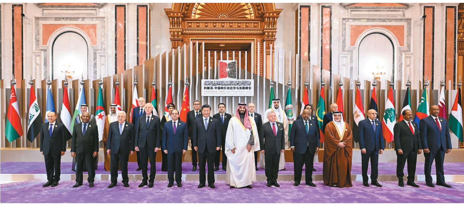
当地时间12月9日下午,首届中国—阿拉伯国家峰会在沙特首都利雅得阿卜杜勒阿齐兹国王国际会议中心举行。国家主席习近平和沙特王储兼首相穆罕默德、埃及总统塞西、约旦国王阿卜杜拉二世、巴林国王哈马德、科威特王储米沙勒、阿联酋总统穆巴拉克、卡塔尔埃米尔塔米姆、摩洛哥国王穆罕默德六世、苏丹总统布尔汉、毛里塔尼亚总统加兹瓦尼、伊拉克总理苏达尼、摩洛哥首相阿赫努什、阿尔及利亚总理阿卜杜拉赫曼、黎巴嫩总理米卡提等21个阿盟国家领导人以及阿拉伯国家联盟秘书长盖特等国际组织负责人出席峰会。 习近平在会上发表题为《弘扬中阿友好精神 携手构建面向新时代的中阿命运共同体》的主旨讲话。

本报利雅得12月9日电 (记者杜尚泽、管克江)当地时间12月9日下午,首届中国—阿拉伯国家峰会在沙特首都利雅得阿卜杜勒阿齐兹国王国际会议中心举行。峰会发表《首届中阿峰会利雅得宣言》,宣布中阿双方一致同意全力构建面向新时代的中阿命运共同体。 国家主席习近平和沙特王储兼首相穆罕默德、埃及总统塞西、约旦国王阿卜杜拉二世、巴林国王哈马德、科威特王储米沙勒、阿联酋总统穆巴拉克、卡塔尔埃米尔塔米姆、摩洛哥国王穆罕默德六世、苏丹总统布尔汉、毛里塔尼亚总统加兹瓦尼、伊拉克总理苏达尼、摩洛哥首相阿赫努什、