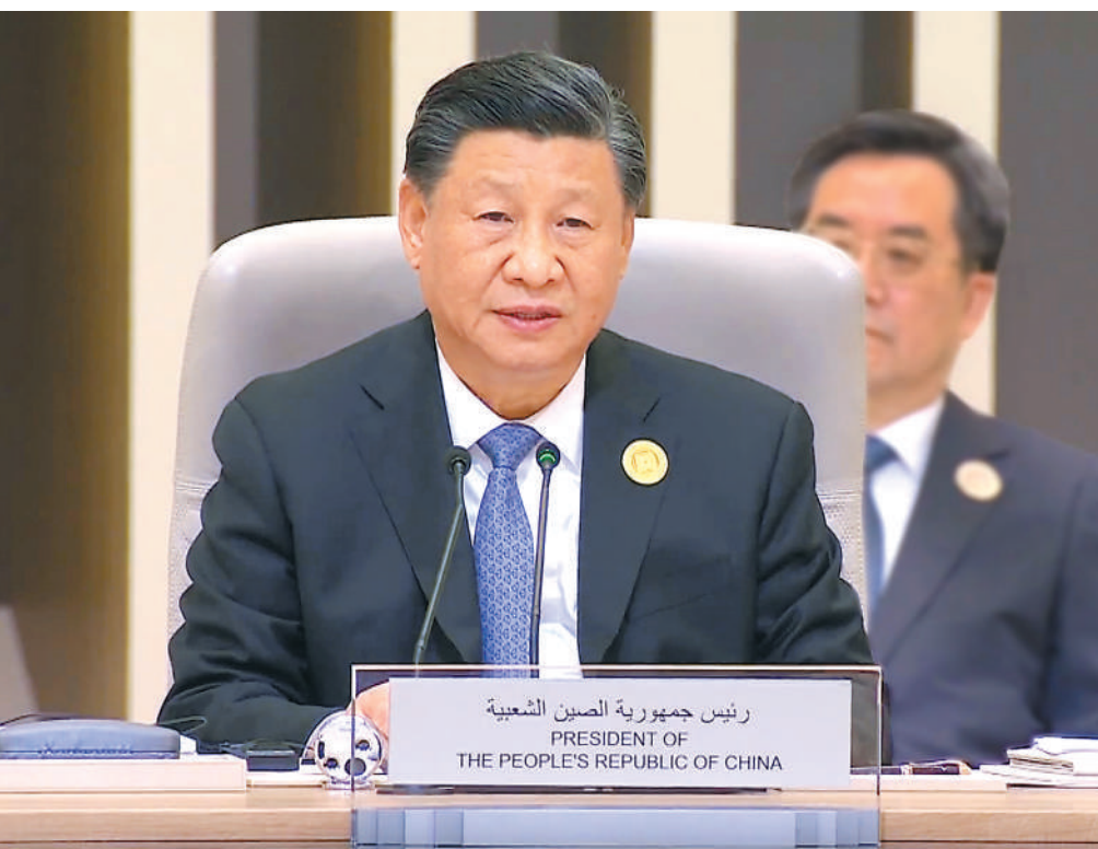
当地时间12月9日下午,首届中国—阿拉伯国家峰会在沙特首都利雅得阿卜杜勒阿齐兹国王国际会议中心举行。国家主席习近平出席峰会并发表题为《弘扬中阿友好精神 携手构建面向新时代的中阿命运共同体》的主旨讲话。

强调弘扬守望相助、平等互利、包容互鉴的中阿友好精神,携手构建面向新时代的中阿命运共同体