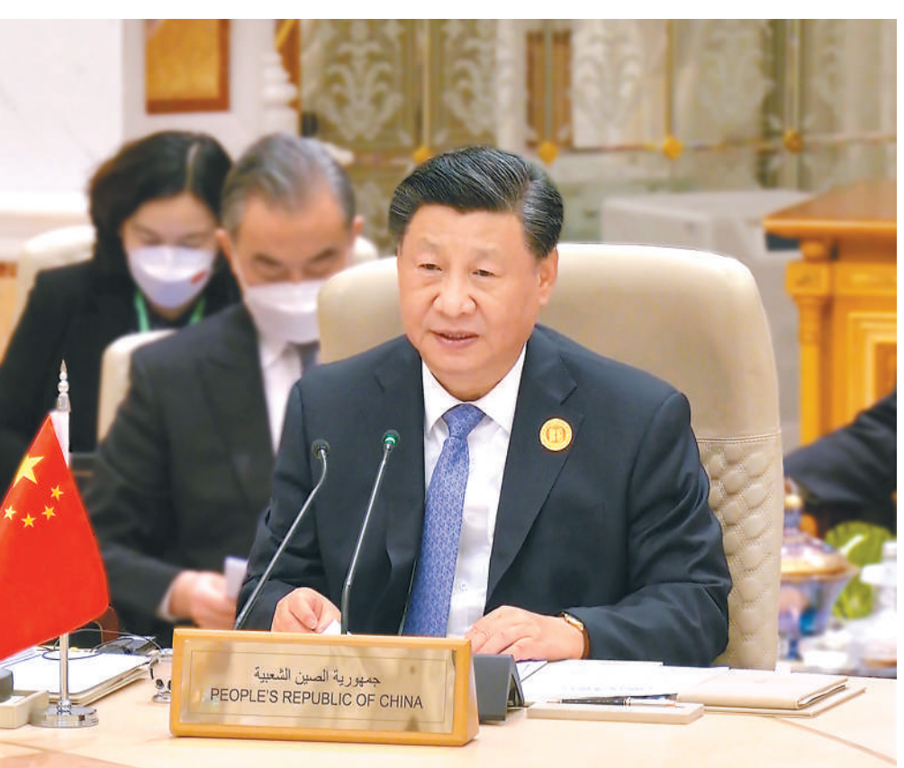
当地时间12月9日下午,首届中国—海湾阿拉伯国家合作委员会峰会在利雅得阿卜杜勒阿齐兹国王国际会议中心举行。国家主席习近平出席峰会并发表题为《继往开来,携手奋进 共同开创中海关系美好未来》的主旨讲话。