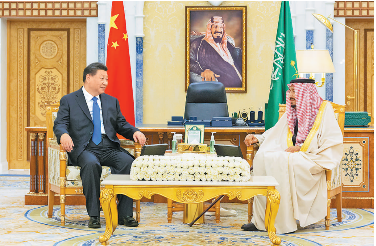
当地时间12月8日下午,国家主席习近平在利雅得王宫会见沙特国王萨勒曼。

本报利雅得12月8日电 (记者杜尚泽、管克江)当地时间12月8日下午,国家主席习近平在利雅得王宫会见沙特国王萨勒曼。 习近平指出,很高兴时隔6年再次访问沙特。我对上次访问沙特的情景记忆犹新。我高兴地看到,我们就发展中沙关系达成的重要共识,正在转化为实实在在的合作成果。中沙合作具有广阔前景。中方视沙特为多极化世界中的重要力量,高度重视发展同沙特的全面战略伙伴关系。中方愿同沙方继续加强战略沟通,深化各领域合作,服务两国的发展利益,维护世界的和平稳定。 萨勒曼表示,热烈欢迎习近平主席再次访问沙特,您2016年对沙特的成功访问令人难忘。近年来,中沙两国战略对接和各领域合作都取得良好进展,双方在诸多问题上都拥有重要共识,中方的利益也就是沙方的利益。我高度重视发展对华关系,愿同习近平主席一道努力,推动中沙全面战略伙伴关系不断向前发展,造福友好的两国人民,这也有利于实现地区和世界的和平稳定与安宁。 两国元首亲自签署《中华人民共和国和沙特阿拉伯王国全面战略伙伴关系协议》,同意每两年在两国轮流举行一次元首会晤。 丁薛祥、王毅参加上述活动。