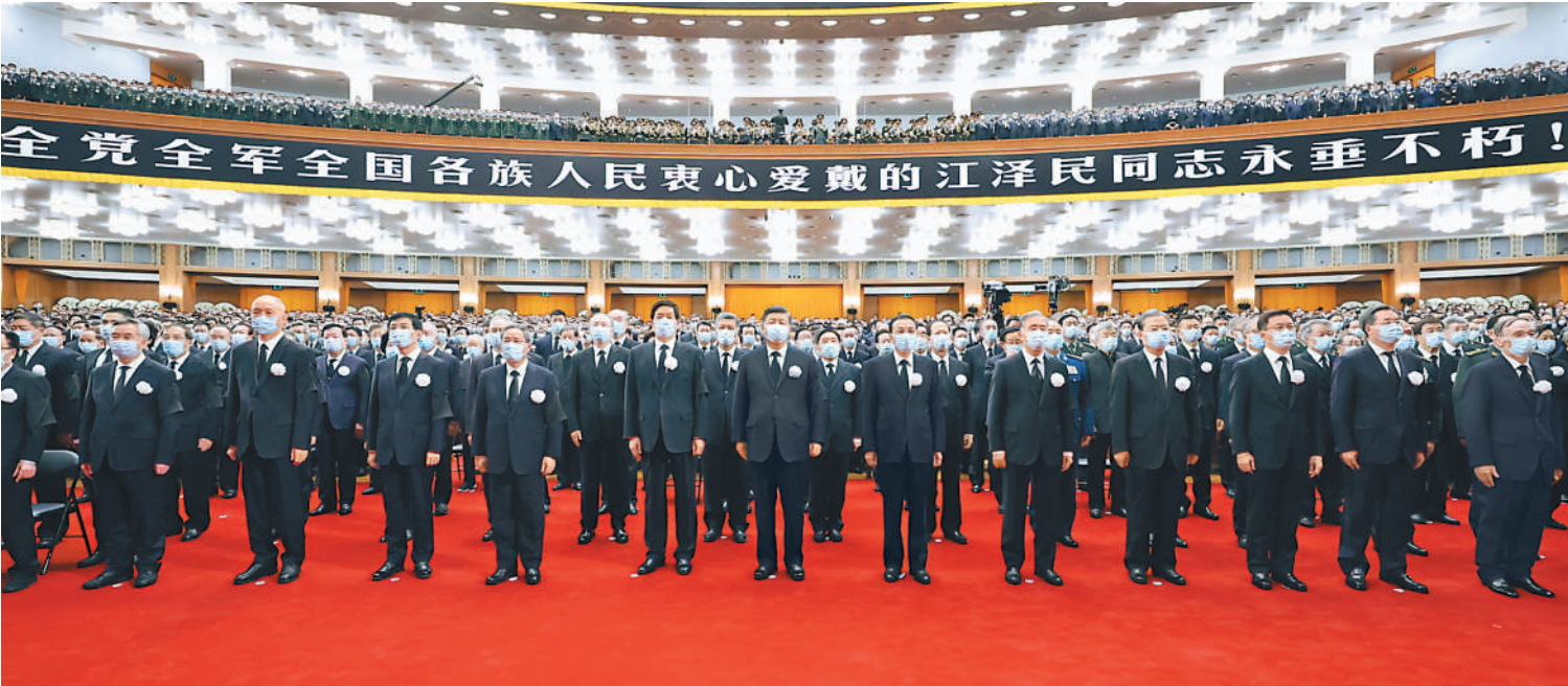
12月6日，中共中央、全国人大常委会、国务院、全国政协、中央军委在北京人民大会堂隆重举行江泽民同志追悼大会。习近平、李克强、栗战书、汪洋、李强、赵乐际、王沪宁、韩正、蔡奇、丁薛祥、李希、王岐山等参加大会。