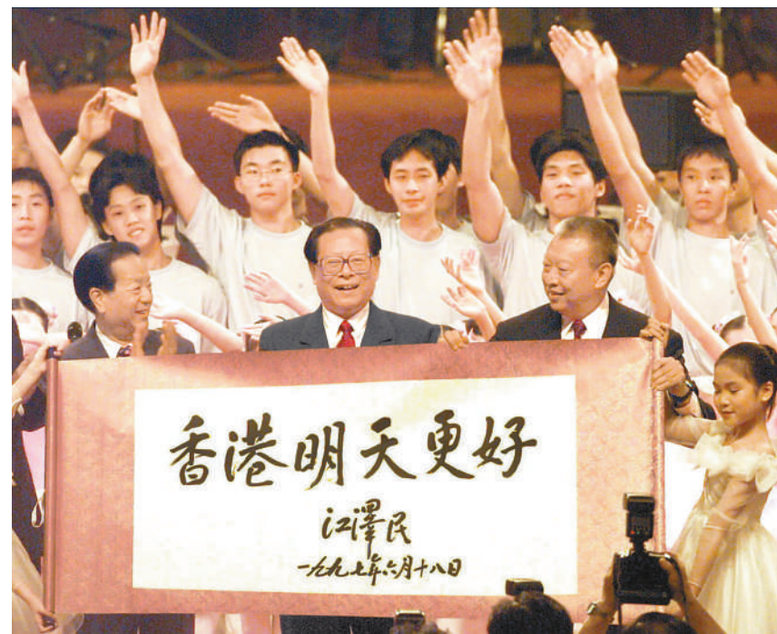
右图:1997年7月1日上午10时,中华人民共和国香港特别行政区成立庆典在香港会展中心新翼举行。在庆典仪式上展示了江泽民同志亲笔题写的“香港明天更好”书法卷轴。