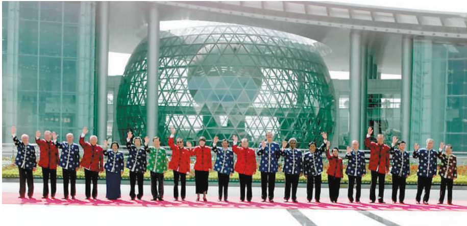
左图:2001年10月21日,亚太经合组织第九次领导人非正式会议在上海举行。这是江泽民同志与参会的经济体领导人合影。