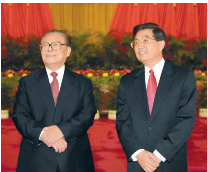
左图:2002年11月15日,江泽民同志、胡锦涛同志在北京人民大会堂亲切会见出席党的十六大代表、特邀代表和列席人员并发表重要讲话。