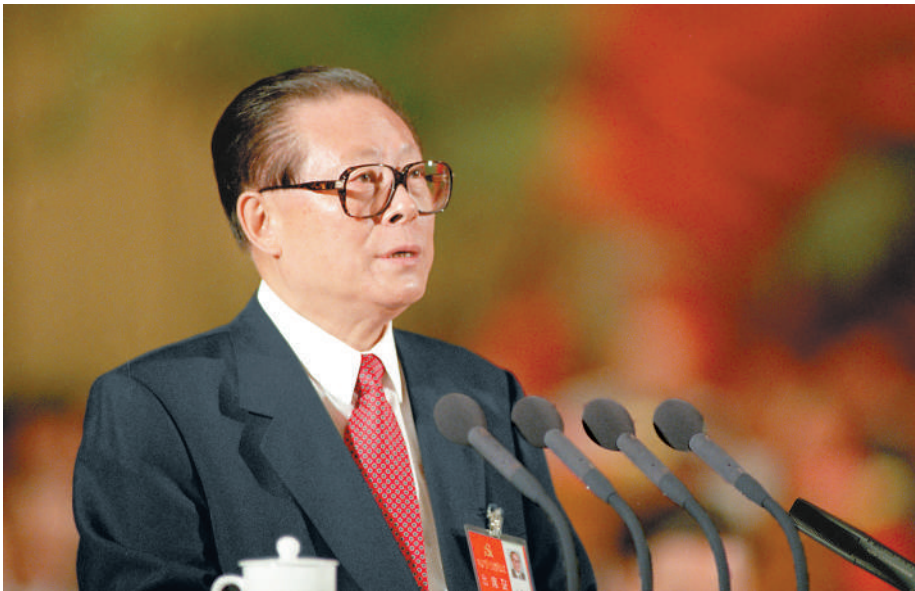
上图:1997年9月12日,中国共产党第十五次全国代表大会在北京人民大会堂开幕。这是江泽民同志代表第十四届中央委员会作报告。