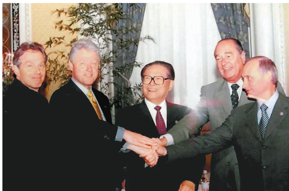
左图:2000年9月7日,由联合国倡议的联合国安理会五个常任理事国首脑会议在纽约举行。江泽民同志(中)同法国总统希拉克(右二)、俄罗斯总统普京(右一)、英国首相布莱尔(左一)、美国总统克林顿(左二)握手合影。