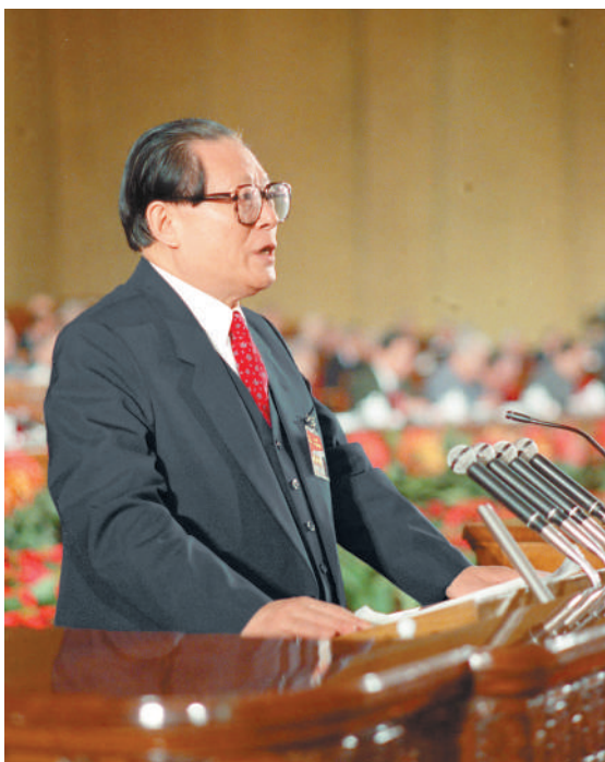
左图:1992年10月12日,中国共产党第十四次全国代表大会在北京人民大会堂开幕。这是江泽民同志代表第十三届中央委员会作报告。