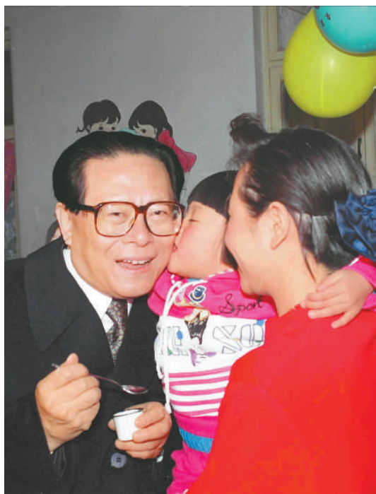
右图:1993年12月5日,江泽民同志在北京为一位幼儿园儿童喂服脊髓灰质炎疫苗后,小朋友亲吻江爷爷。