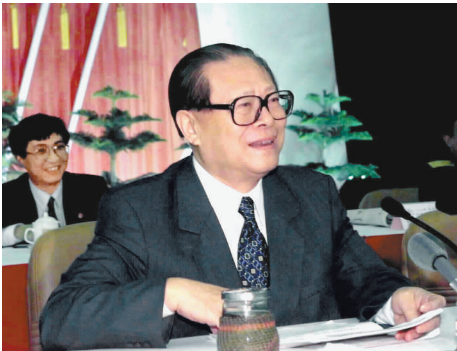
上图:2000年2月20日,江泽民同志在广东省高州市领导干部“三讲”教育会议上发表重要讲话。在这次广东考察中,江泽民同志提出,我们党总是代表着中国先进生产力的发展要求,代表着中国先进文化的前进方向,代表着中国最广大人民的根本利益。