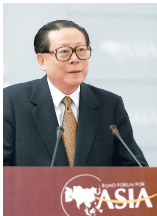
上图:2001年2月27日,博鳌亚洲论坛成立大会在海南举行。江泽民同志出席成立大会并致辞。