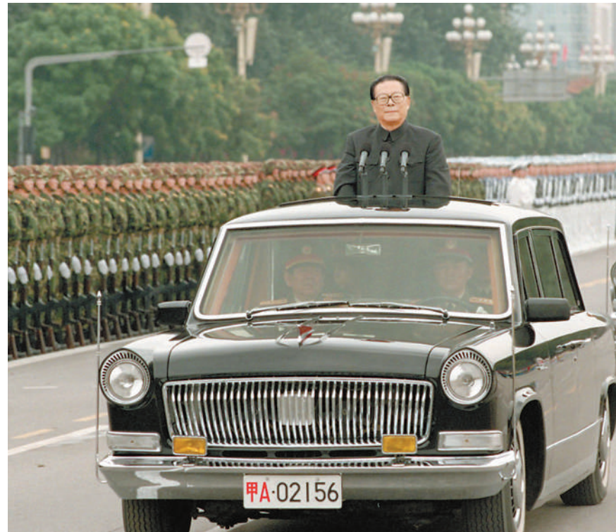
左图:一九九九年十月一日,中华人民共和国成立五十周年盛大庆典在北京天安门广场举行。江泽民同志检阅由人民解放军陆海空三军和人民武装警察部队、民兵预备役部队组成的地面方阵。