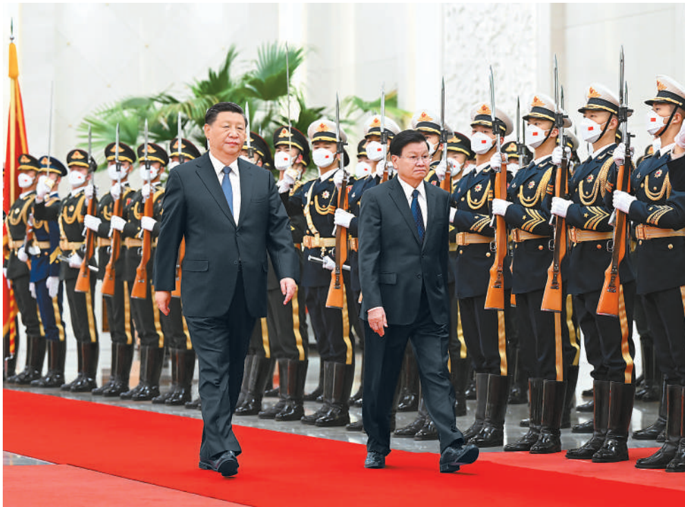
11月30日，中共中央总书记、国家主席习近平在北京人民大会堂同老挝人民革命党中央总书记、国家主席通伦举行会谈。

讲话强调，我们的党员、干部，不论在任还是从工作岗位上退下来了，无论在什么时候、什么地方、什么场合，都要始终牢记自己是一名共产党员，都要始终发挥先锋模范作用，都要始终坚持和维护党的领导、维护党的团结统一。所有共产党员都要牢记“国之大者”，都要坚定中国特色社会主义道路自信、理论自信、制度自信、文化自信，都要增强党员意识，都要保持战略清醒，为党和人民事业奋斗不止。