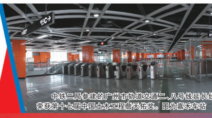
中铁三局参建的广州市轨道交通三、八号线延长线工程荣获第十七届中国土木工程詹天佑奖。图为嘉禾车站