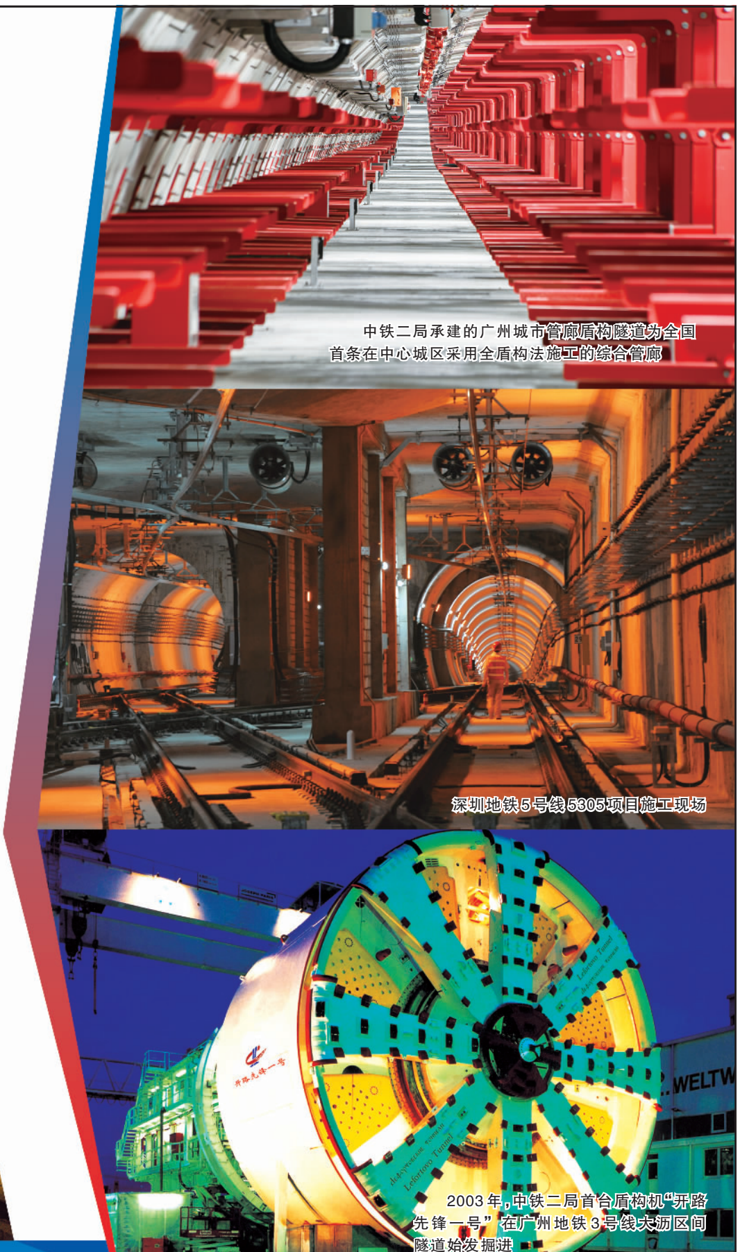
中铁二局承建的广州城市管廊盾构隧道为全国首条在中心城区采用全盾构法施工的综合管廊