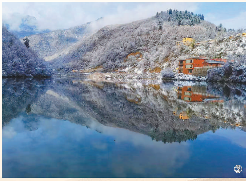
图①：俯瞰鹿仁。胡卫东摄（人民视觉） 图②：村民交谈。胡卫东摄（人民视觉） 图③：碧波如镜。杨明霞摄（人民视觉）