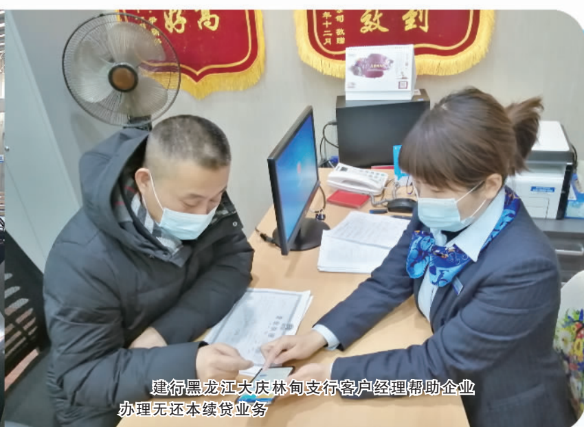
建行黑龙江大庆林甸支行客户经理帮助企业办理无还本续贷业务