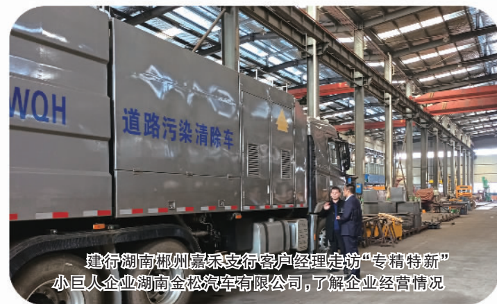
建行湖南郴州嘉禾支行客户经理走访“专精特新”小巨人企业湖南金松汽车有限公司，了解企业经营情况

自创立以来，“建行惠懂你”始终坚持以服务小微企业、个体工商户等普惠客户需求为核心，解决小微企业贷款手续繁、融资慢等问题，为小微企业提供“一分钟”融资、“一站式”服务、“一价式”收费的信贷