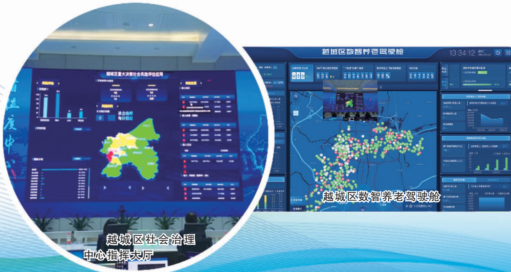
越城区数智养老驾驶舱