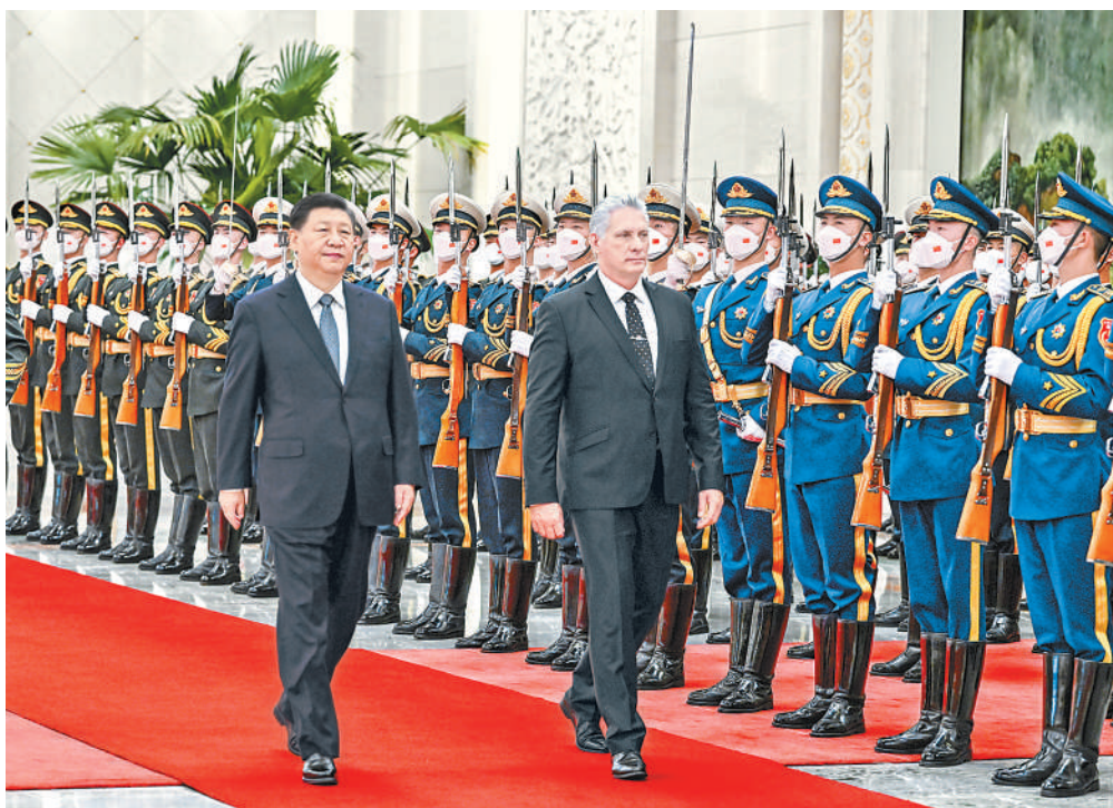
11月25日,中共中央总书记、国家主席习近平在北京人民大会堂同来华进行国事访问的古巴共产党中央委员会第一书记、古巴国家主席迪亚斯—卡内尔举行会谈。这是会谈前,习近平在人民大会堂北大厅为迪亚斯—卡内尔举行欢迎仪式。