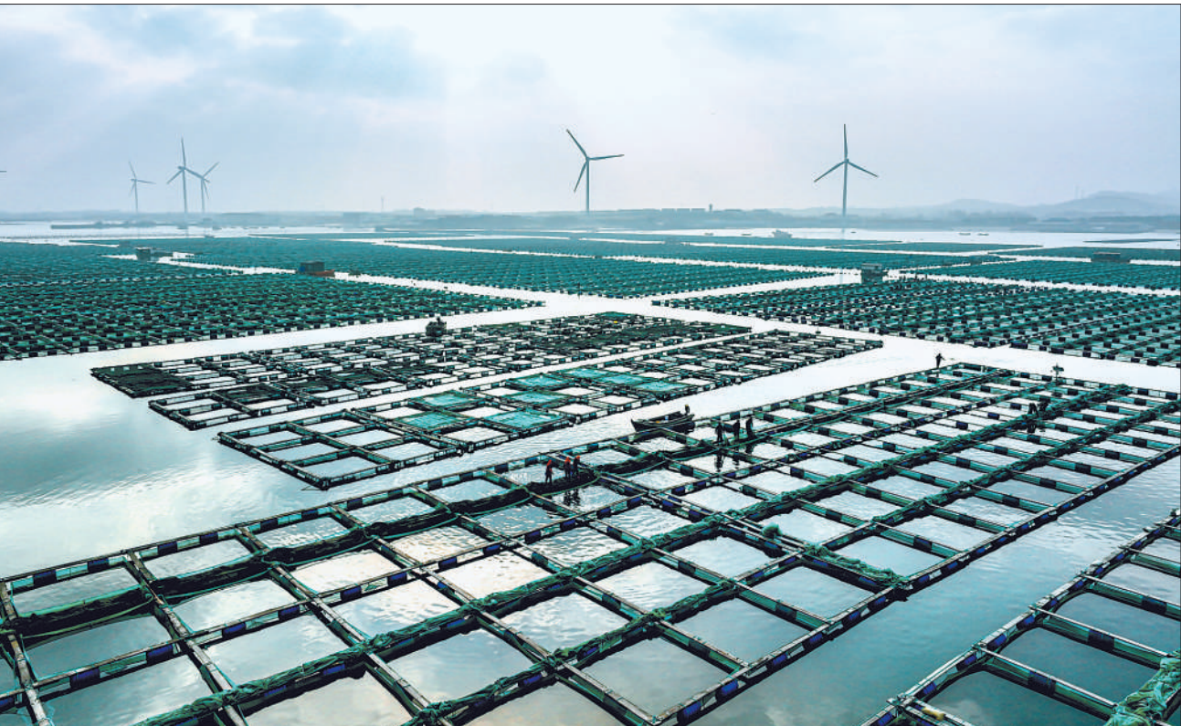
山东省荣成市近年来大力发展海上养殖经济,打造海上“订单渔业”,积极探索浅海多营养层次生态养殖模式,助力渔民增收致富。图为11月24日,荣成市石岛管理区桑沟湾海洋牧场生态养殖区,渔民们在收获海产品。

针对前期探井测试产量低、不稳定的问题,攻关团队创新形成深层页岩立体缝网压裂技术,初步打通了深层页岩的“七经八脉”,页岩气沿着这些立体通道源源不断流出,提产效果显著。